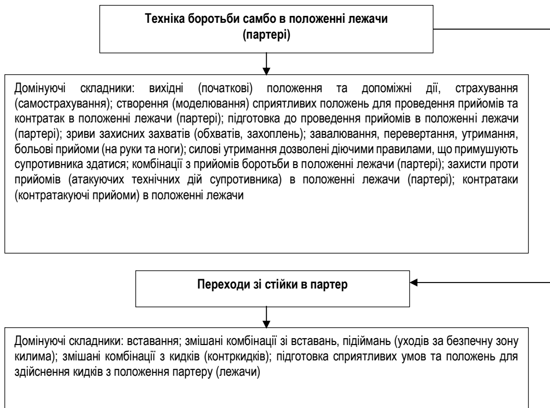
Рис. 1. Складники техніки боротьби самбо в положенні лежачи (спортивний розділ)

Крім цього, членами науково-дослідної групи (НДГ) встановлено, що на успіх змагальної сутички в положенні лежачи (партері) впливає швидкість техніко-тактичних дій. У свою чергу, коли боротьба перейшла в положення лежачи, борцю який здійснює атаку доцільно змінити темп сутички і використовуючи перевагу в положенні чи захваті утримувати переважаючу позицію упродовж тривалого часу. Однак, як тільки боротьба з позиційної перейшла в активну фазу – необхідно як-мога швидше звільнитися від захвату і перейти в інше положення (провести контрприйом).