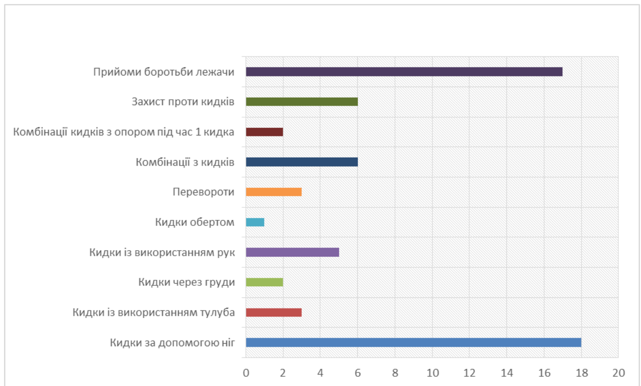
Рис. 2. Основні групи техніко-тактичних дій боротьби самбо (спортивний розділ)

В процесі подальшої дослідно-аналітичної роботи нами були визначені прийоми з відповідної групи техніко-тактичних дій досліджуваного одноборства, які є достатньо ефективні, однак на думку експертів вважаються рідкісними: