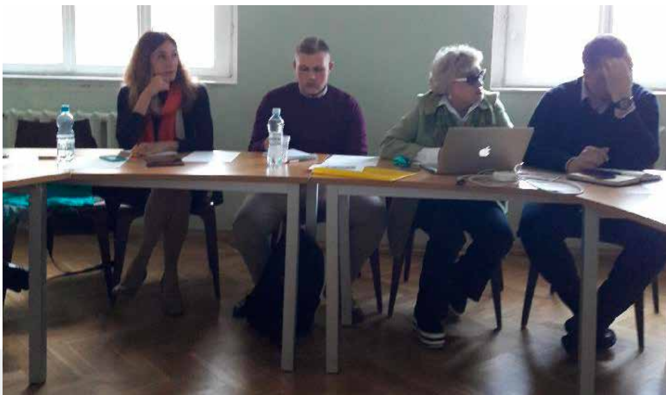
Seminārs «Izglītības piedāvājuma izpētes migrantu iekļaušanai sabiedrībā pirmie secinājumi» Семинар «Освітня поставка для дослідження включення мігрантів у суспільство перші висновки» 23.04.2018