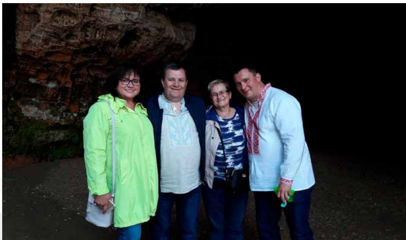
Sigulda, Gūtmaņa alā. Сигулда, печера Гутмана 21.06.2017