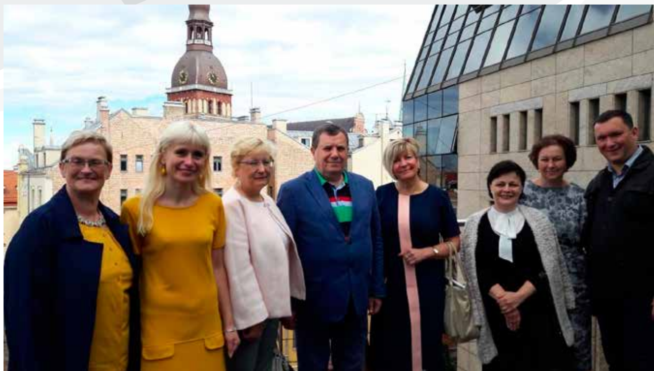
Rīgas domē ar skatu uz Vecrīgu. Ризька міська рада з видом на Старе місто 21.06.2017