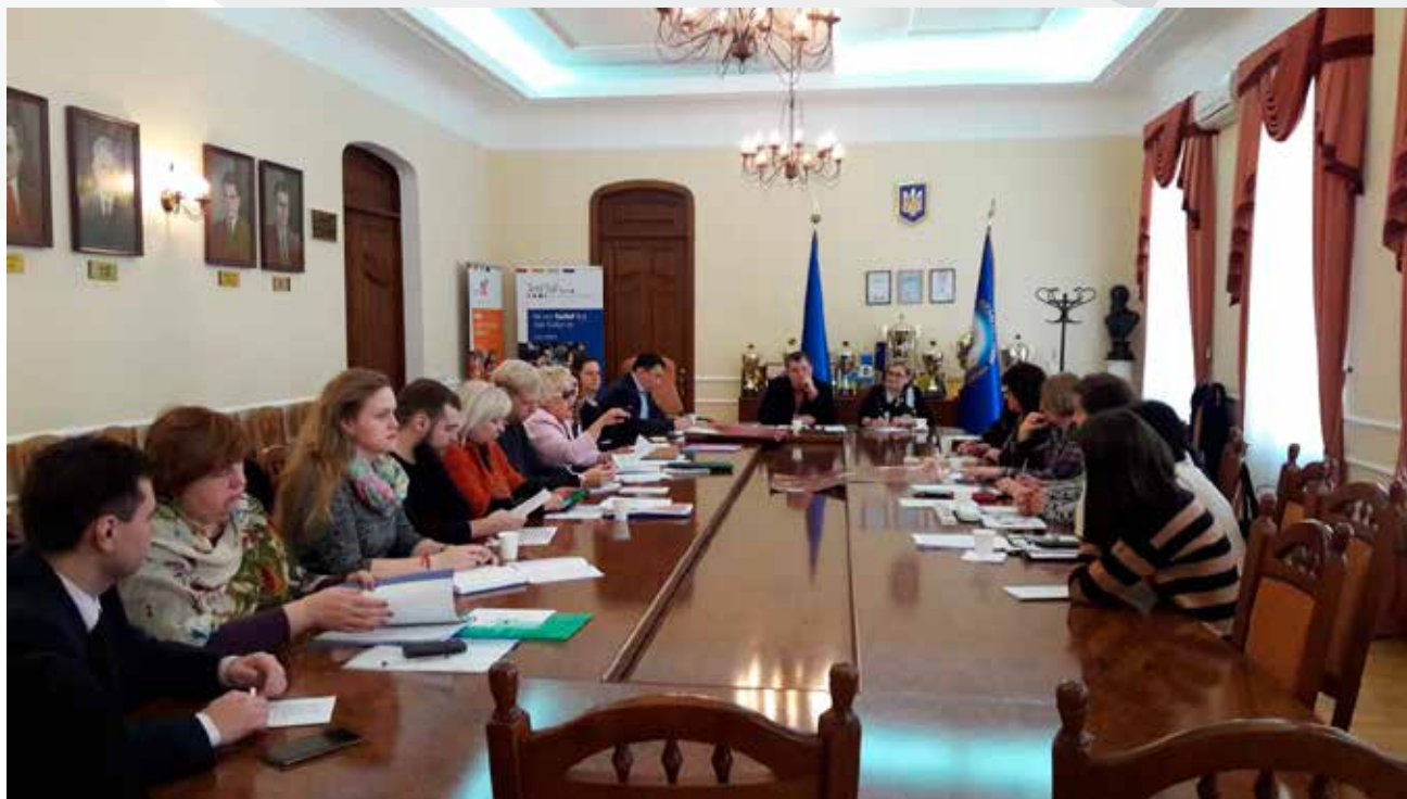
Дискусія: «Освітній простір у мультикультурному середовищі: тренди ХХІ століття» Diskusija «Izglītības telpa multikultūru vidē: 21.gadsimta tendences» 28.03.2017