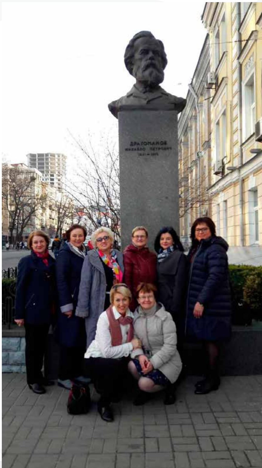
Перед поїздкою до Чернігова біля пам'ятника Драгоманову Pirms brauciena uz Čerņigovu pie Dragomanova pieminekļa 29.03.2017