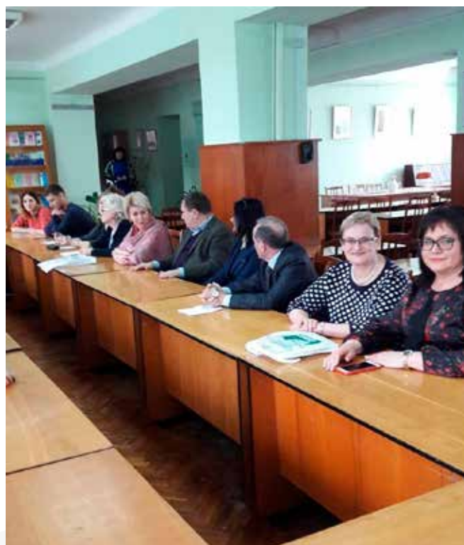
Обговорення у Чернігівському національному педагогічному університеті ім. Шевченка Diskusija Ķerņigovas Nacionālā Ševčenko Pedagoģiskajā universitātē