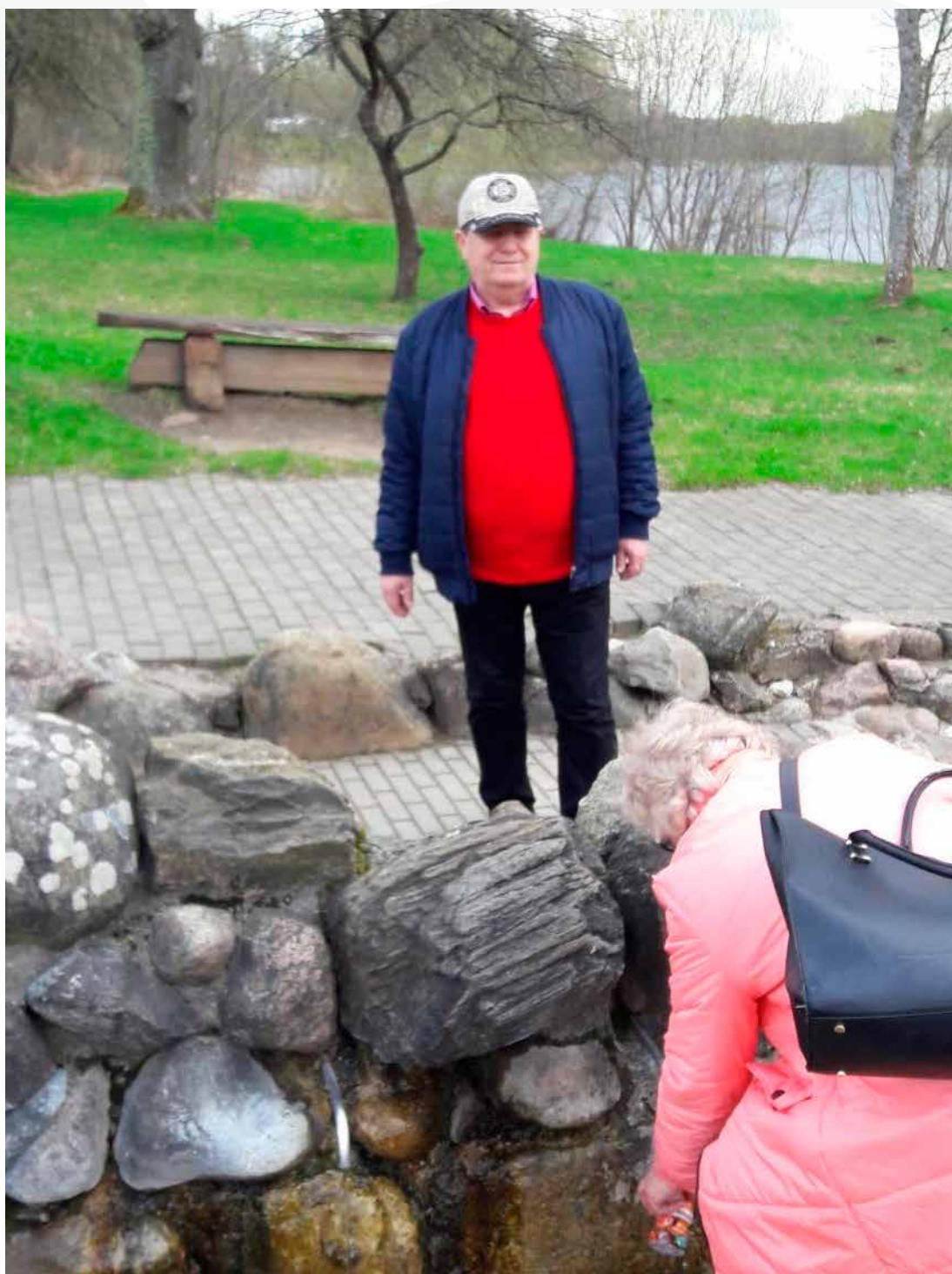
Pie svētavota Aglonas bazilikā У святелище в базиліці Аглола 24.04.2018