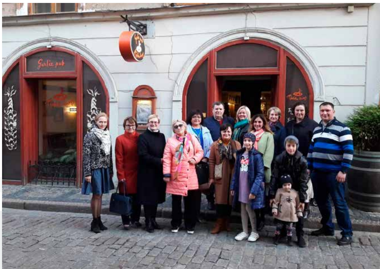
Projekta dalībnieki pirms semināra Vecrīgā Учасники проекту перед початком семінару у Старій Ризі 22.04.2018