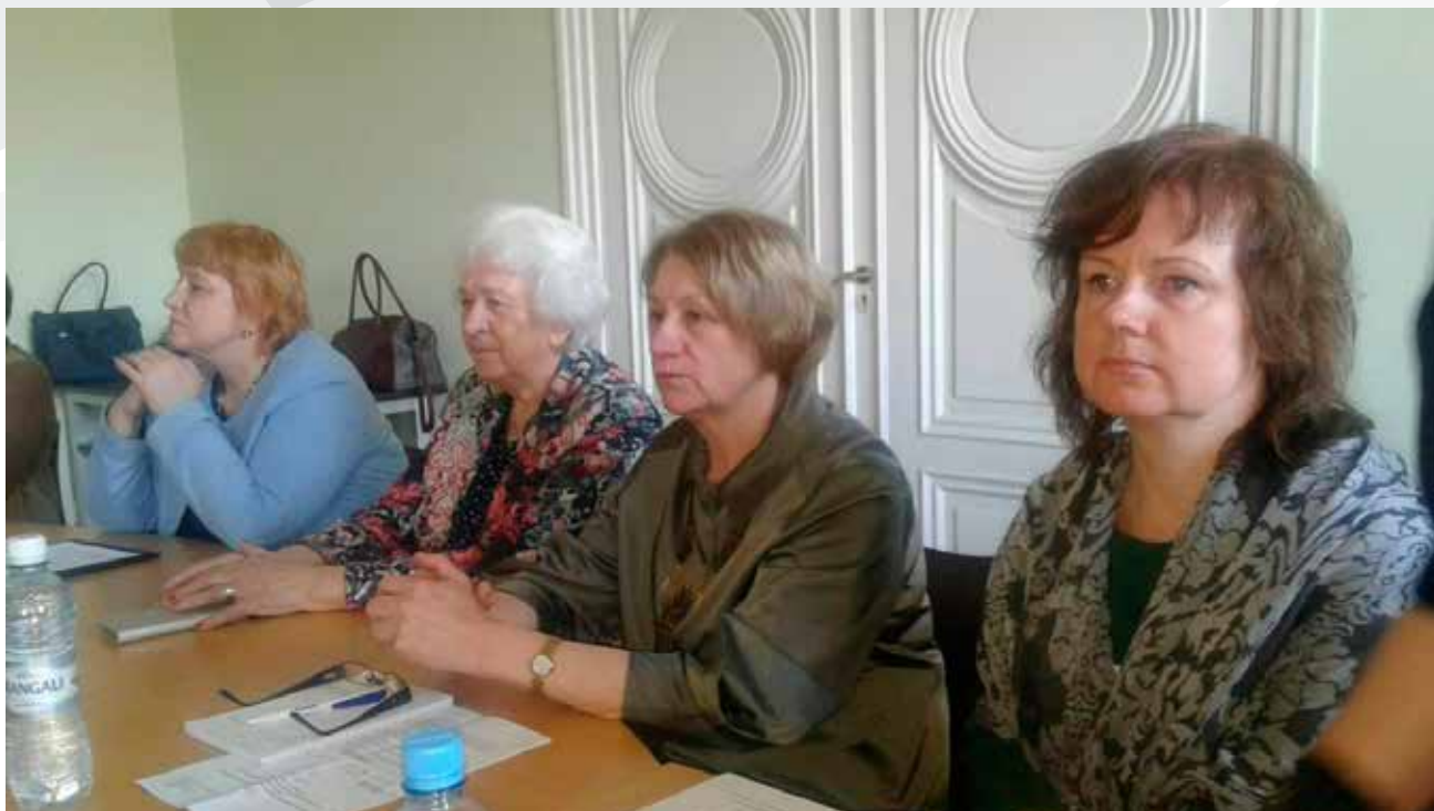
Seminārs «Izglītības piedāvājuma izpētes migrantu iekļaušanai sabiedrībā pirmie secinājumi» Семинар «Освітня поставка для дослідження включення мігрантів у суспільство перші висновки» 23.04.2018