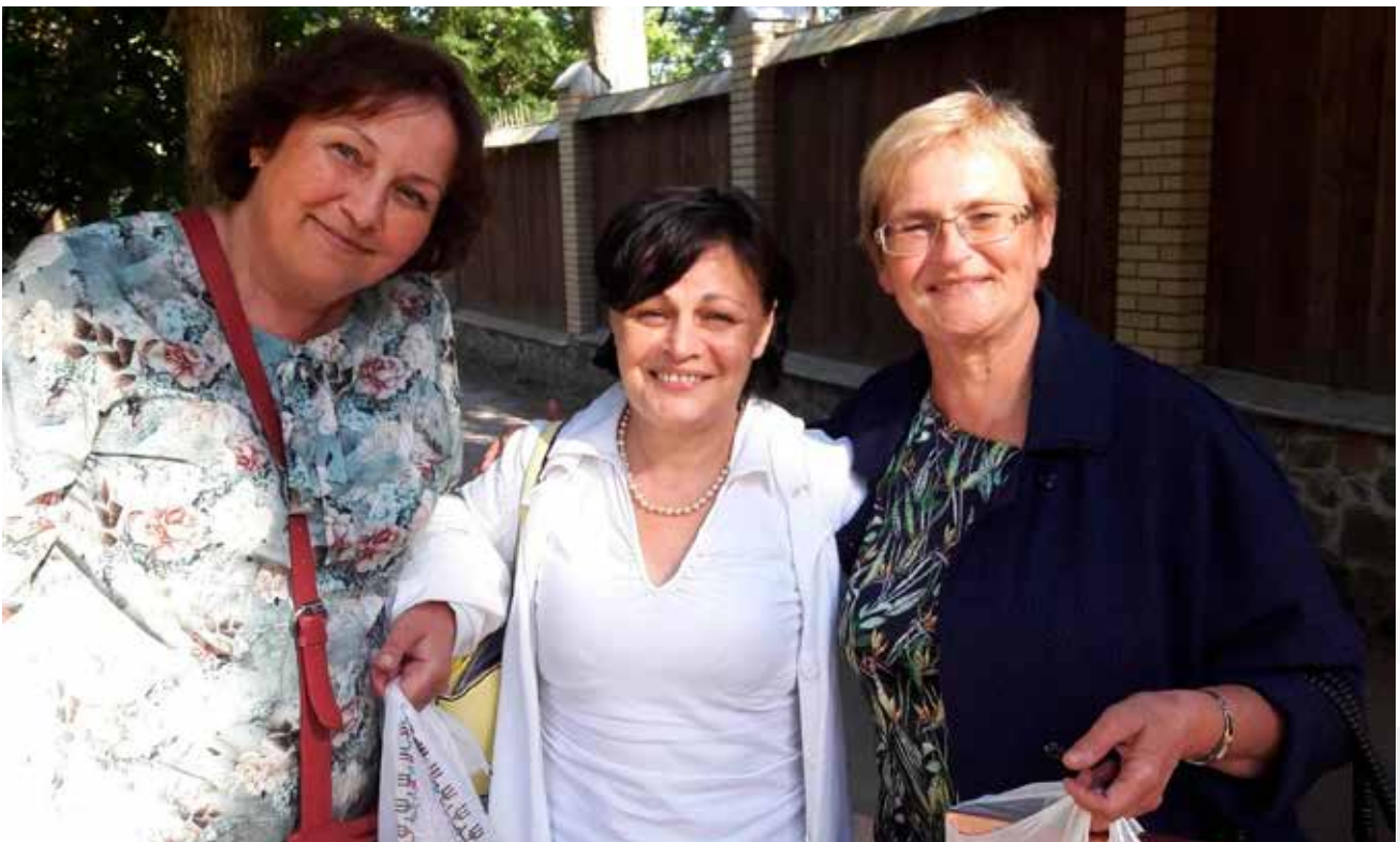
Pēc semināra Після майстерні 06.06.2018