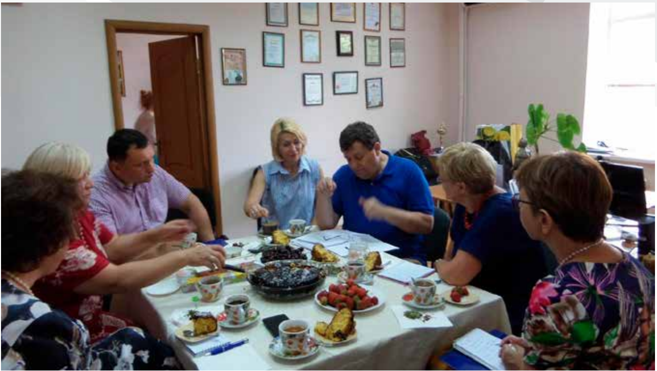
Seminārs «Pētījuma rezultātu analīze» Семинар «Аналіз результатів досліджень» 05.06.2018