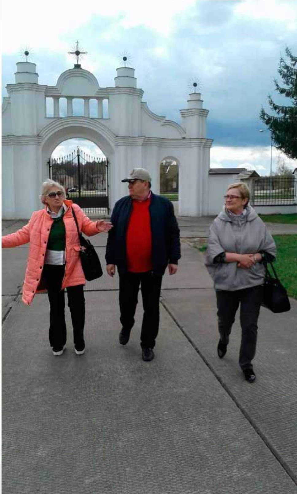
Pie Aglonas bazilikas vārtiem У воротах Базиліки в Аглолі 24.04.2018