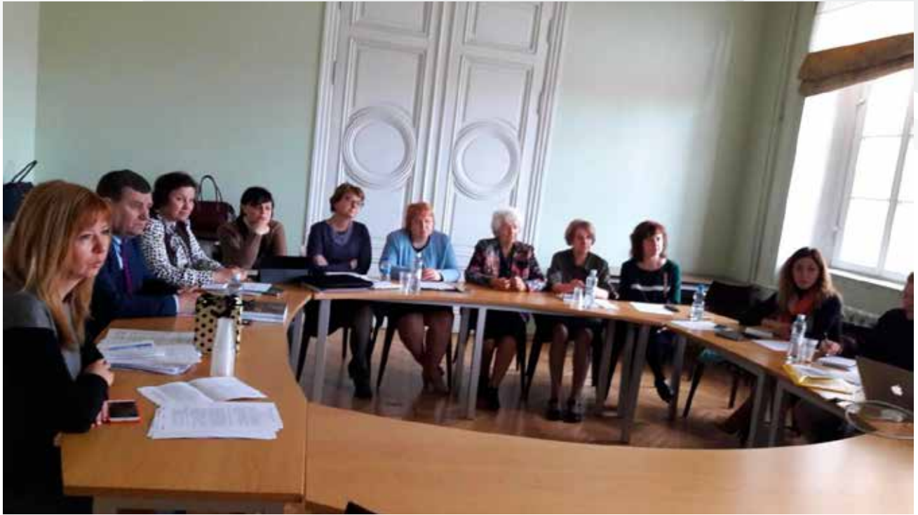
Seminārs «Izglītības piedāvājuma izpētes migrantu iekļaušanai sabiedrībā pirmie secinājumi» Семінар «Освітня поставка для дослідження включення мігрантів у суспільство перші висновки» 23.04.2018