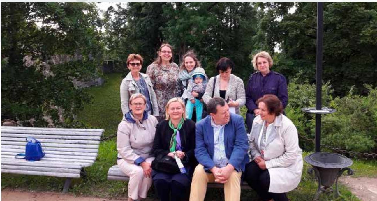
Пēc Cēsu pils muzeja apmeklējuma Після відвідин музею Цесізького замку 20.06.2017