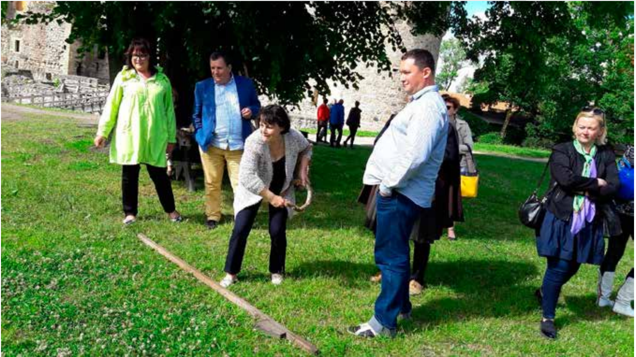
Cēsu pils muzeja apmeklējums Відвідування Музею замка міста Цесіс 20.06.2017