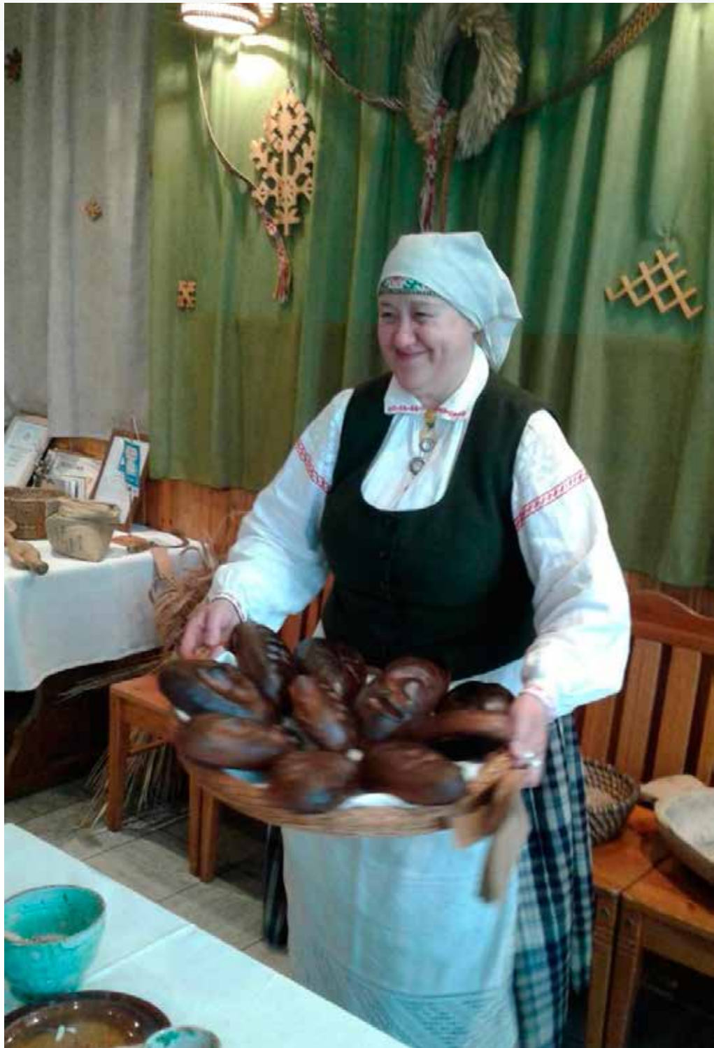
Maizes muzejā Aglonā Хлібний музей в Аглолі 24.04.2018