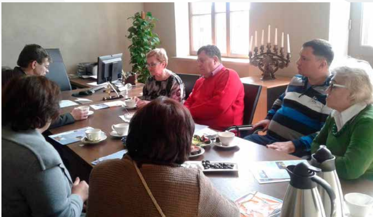
Diskusija. «Reemigranti un imigranti augstskolas vidē» Дискусія «Переселенське та іммігрантське середовище вищої школи» 24.04.2018