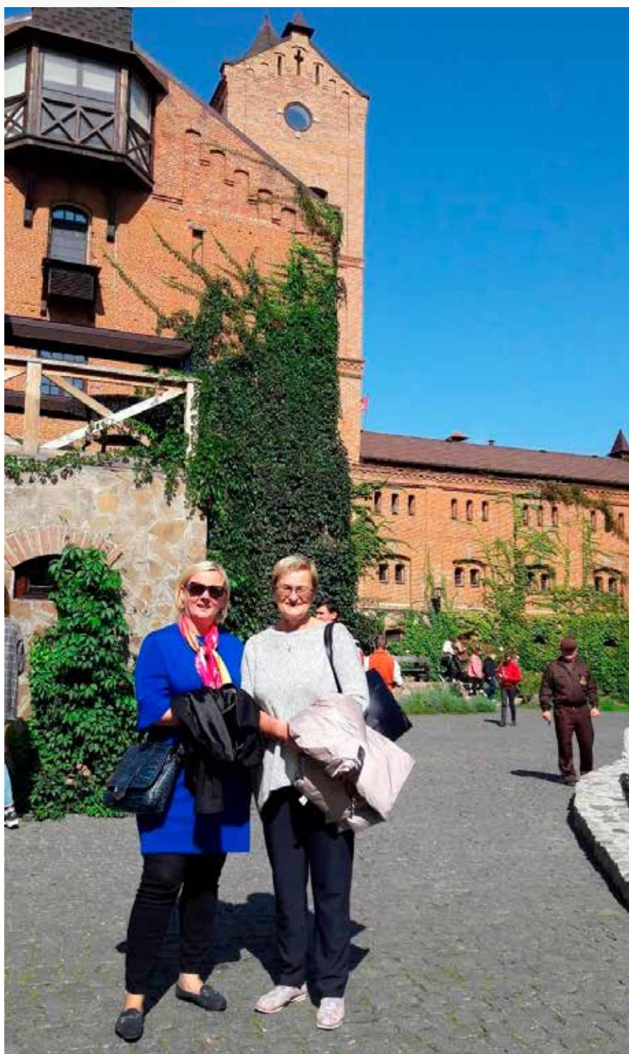
Pie Radomislas pils muzeja Žitomiras apgabalā. У Радомишлі Музей замку Житомирського району 09.09.2017