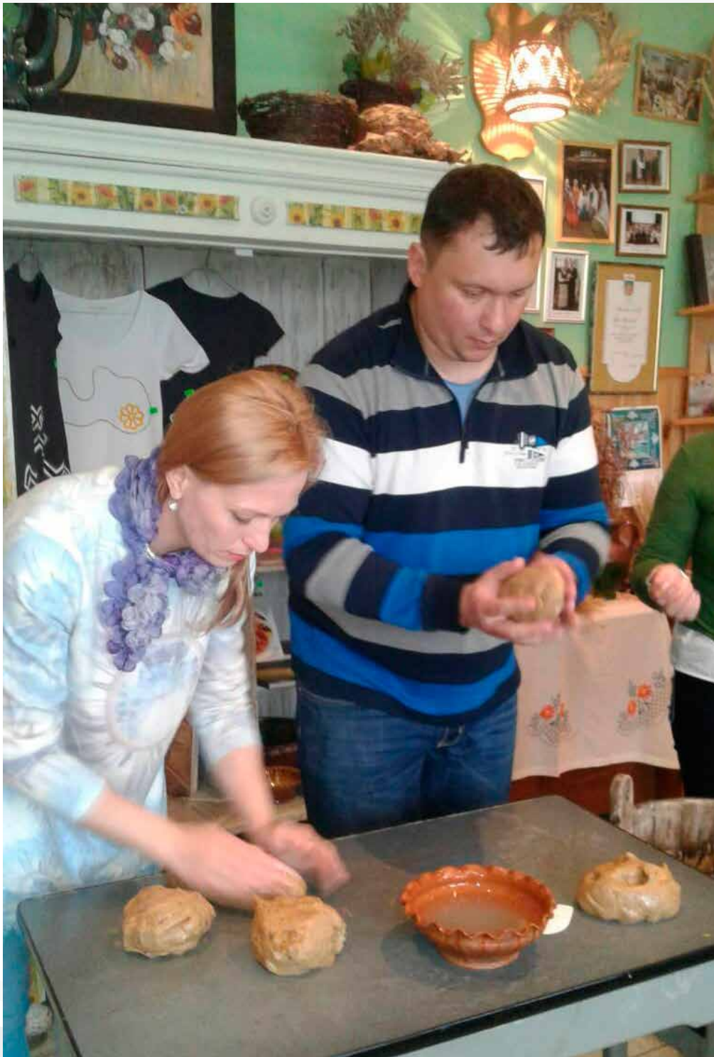
Maizes muzejā Aglonā Хлібний музей в Аглолі 24.04.2018