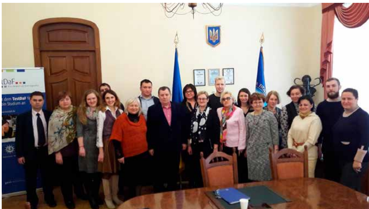
Учасники дискусії: «Освітній простір у мультикультурному середовищі: тренди ХХІ століття» Diskusijas «Izglītības telpa multikultūru vidē: 21.gadsimta tendences» dalībnieki 28.03.2017.