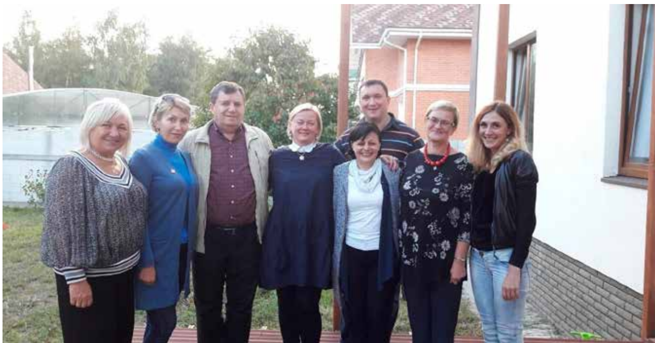
Семинар проекту Projekta seminārs 08.09.2017