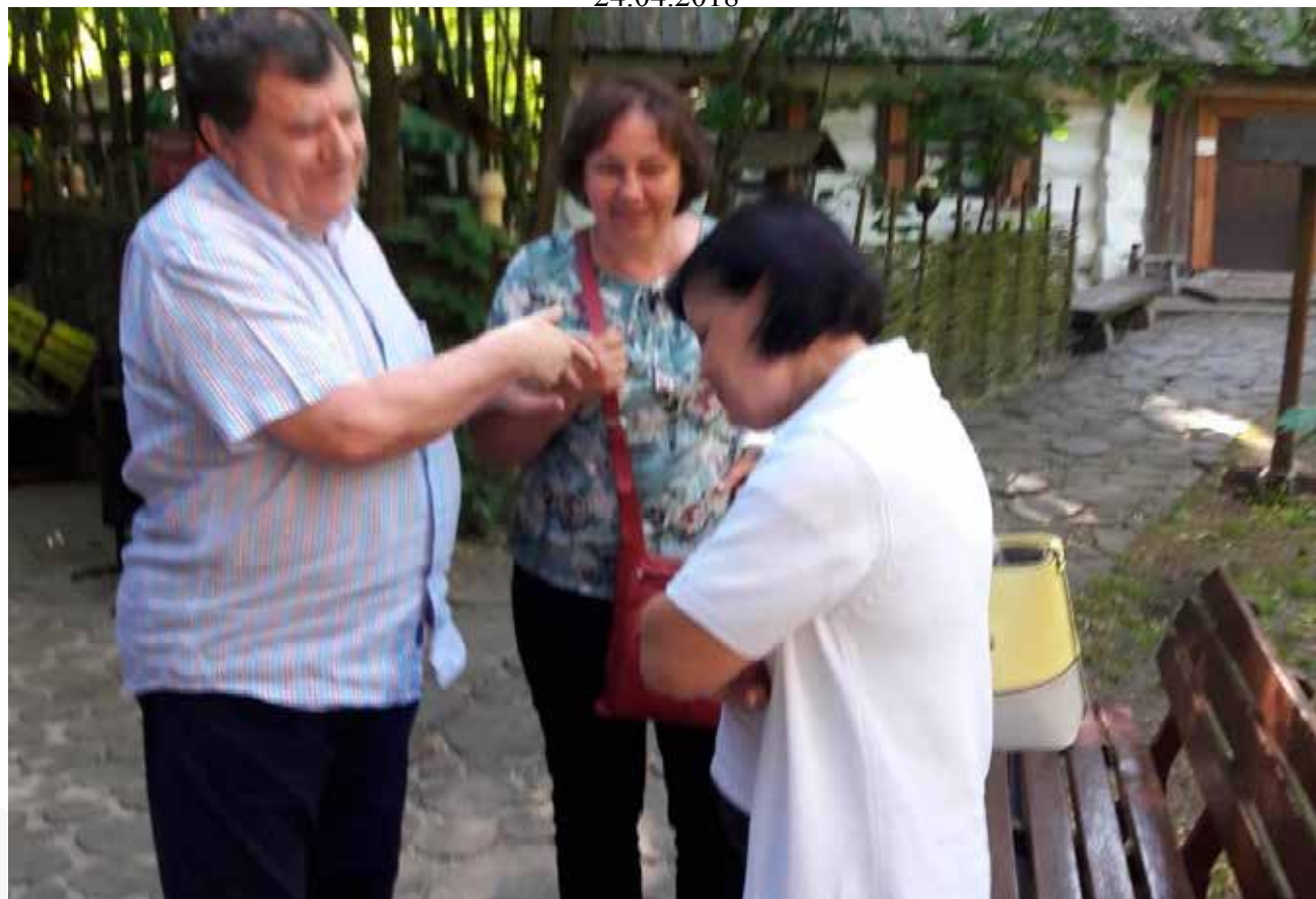
Pēc semināra Після майстерні 06.06.2018