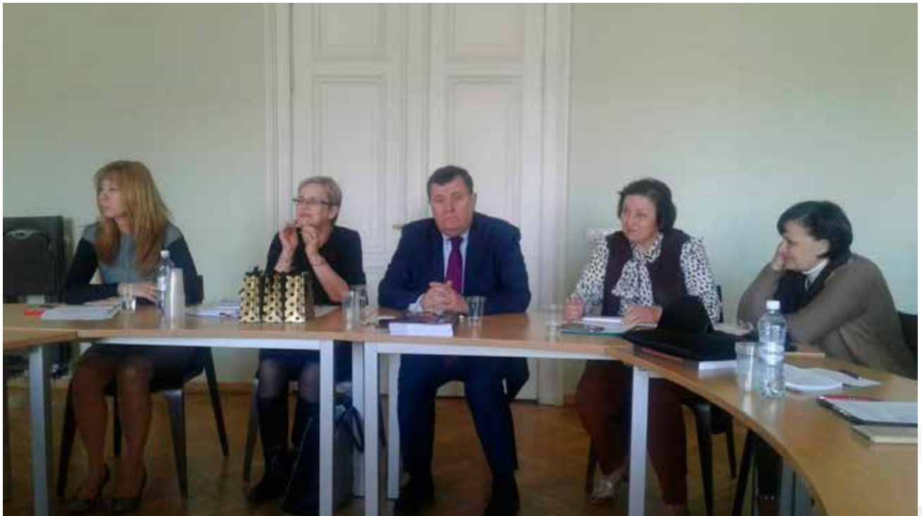
Seminārs «Izglītības piedāvājuma izpētes migrantu iekļaušanai sabiedrībā pirmie secinājumi» Семінар «Освітня поставка для дослідження включення мігрантів у суспільство перші висновки» 23.04.2018