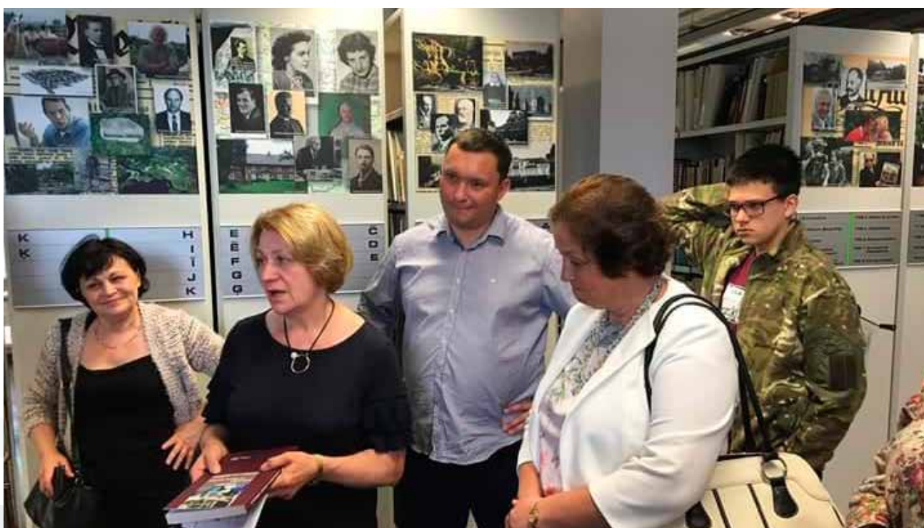
Cēsu pilsētas bibliotēkā Цесіс міська бібліотека 20.06.2017