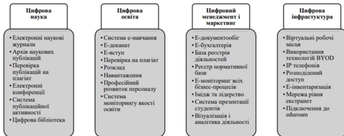
Рис. 2. Компоненти цифрового кампусу [10]

Буйницька О., Варченко-Троценко Л., Грицеляк Б. у своєму спільному дослідженні визначили компоненти цифрового кампусу (див. рис. 2), що мають відповідати потребам ЗВО: цифрова наука, цифрова освіта, цифровий менеджмент і маркетинг, цифрова інфраструктура [10].