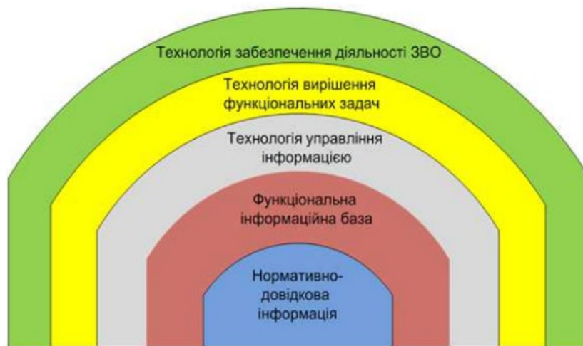
Рис. 1. Концентрична модель інформаційної технології цифрової трансформації ЗВО [2]

У результаті автори запропонували здійснювати цифрову трансформацію ЗВО “на основі використання розробленої концентричної інформаційної технології, яка інтегрує всі інформаційні бази, методи та засоби розв’язання функціональних завдань в єдиний цифровий простір задля максимального забезпечення інформаційних потреб закладів вищої освіти” [2]. Запропонована модель представлена на рис. 1, і включає в себе: три технології – забезпечення діяльності ЗВО, вирішення функціональних задач та управління інформацією, а також функціональну інформаційну базу та нормативно-довідкову інформацію [2].