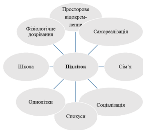
Рис. 1. Різномісний вплив на поведінку підлітка

Саме на цьому етапі життя необхідно залучати молодь до корисної діяльності, яка надалі може стати професійною. Модель підготовки підлітків до волонтерської діяльності, яка зображена на рис. 2, передбачає залучення підлітка до волонтерства, визначення напрямку діяльності та безпосередню роботу волонтером, що і буде сприяти підвищенню ступеня готовності взаємодіяти з соціумом.