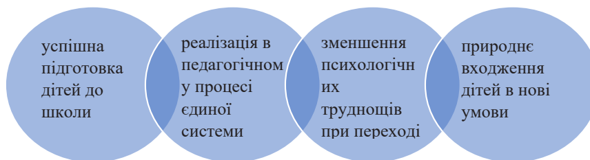
Рис. 2. Значення наступності в інклюзивному освітньому середовищі

Вважаємо, що забезпечення принципів наступності для дітей з особливими освітніми потребами створює успішну підготовку дітей до школи, реалізацію динамічної та перспективної системи виховання і навчання, яка забезпечує формування особистості, природного входження дітей в нові умови, що сприяє підвищенню ефективності навчання, поступове розкриття потенціалу дитини з ООП, зменшення психологічних труднощів та навантаження при переході до нових умов навчання (рис. 2).