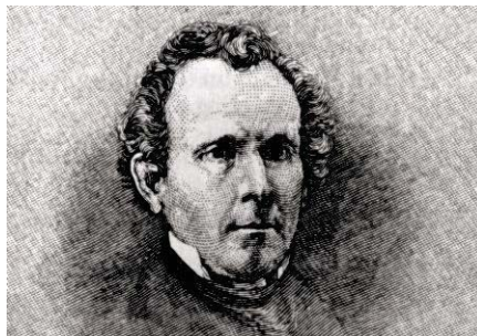
Рис. 1. Сильвестр Грем [3]

Сильвестр Грем розробив так звану “Науку про людське життя”, яка закликала до помірності у всіх сферах. Реформатор також наголошував на важливості особистої гігієни, прийнятті ванн та ефективності гідротерапії для лікування найрізноманітніших захворювань. “Водне лікування” набуло популярності у США на початку 1840-х років. Сильвестр Грем також розглядав надмірний секс та мастурбацію основними причинами низки хвороб, психічних розладів та проявів слабкості. Активне розповсюдження його ідей та ріст кількості послідовників, яких називали “гремітами”, призвели до фінансового успіху та заснування пансіонів, де пропагувалася строга дієта і сексуальна стриманість.