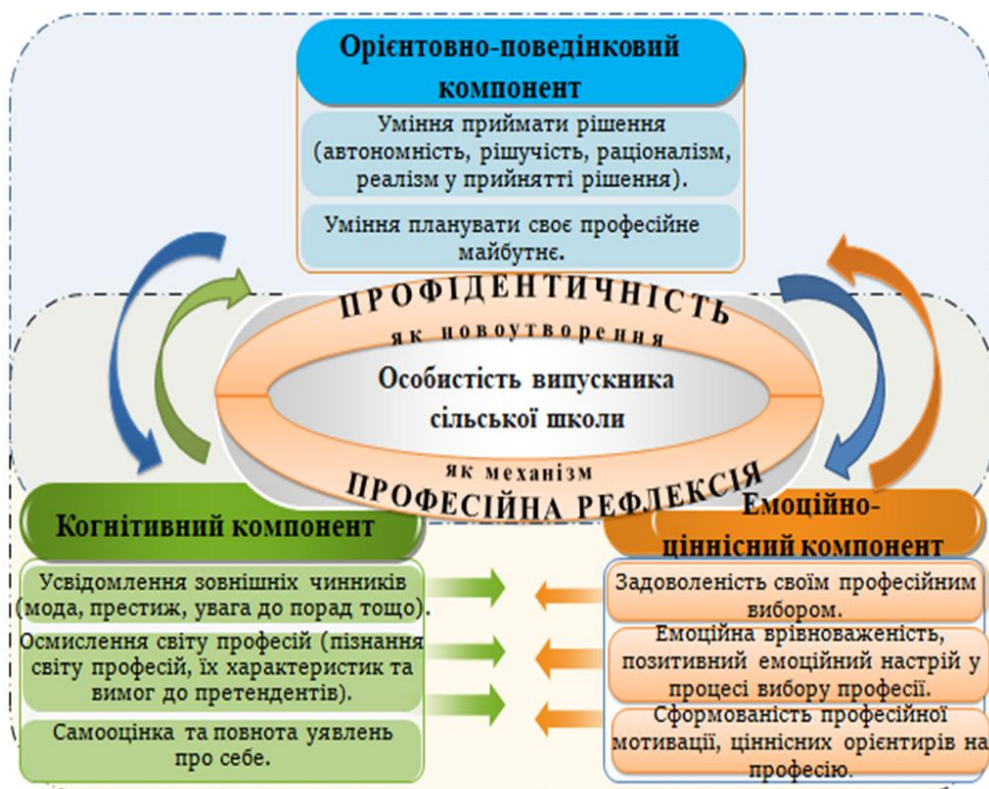
Рис. 1. Модель професійного самовизначення випускників сільських шкіл

Теоретичний аналіз дозволив презентувати модель професійного самовизначення випускників як «складноорганізовану систему взаємопов'язаних між собою компонентів і їх конструктів: когнітивний (пізнання світу професій, самооцінка власних здібностей, усвідомлення зовнішніх чинників), емоційно-ціннісний (ціннісне ставлення до вибору фаху, задоволеність своїм професійним вибором), орієнтовно-поведінковий (уміння планувати й проектувати професійне майбутнє, уміння приймати рішення)» (рис.1.).