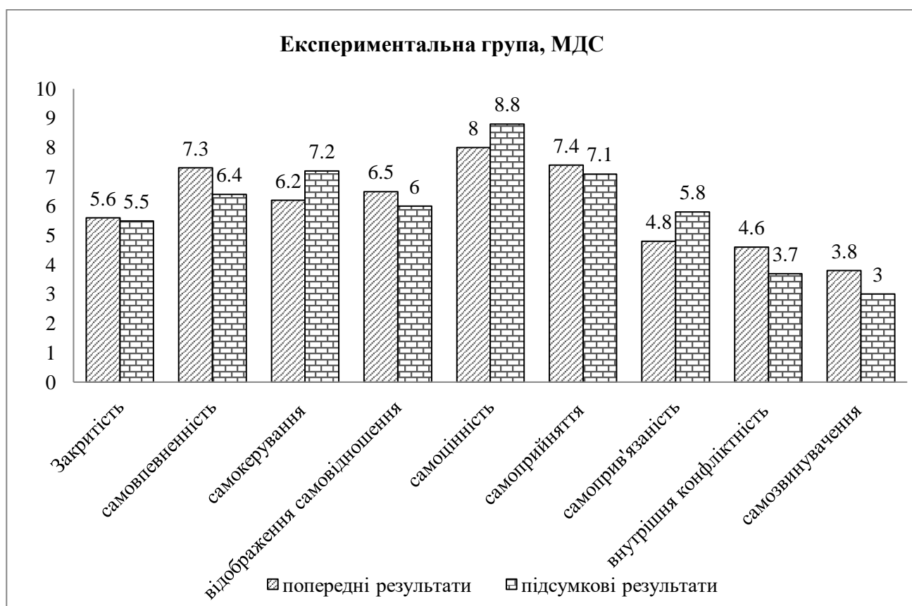
Рис. 1. Середні значення експериментальної групи за методикою МДС

Аналізуючи виразність показників самоствавлення учасників арт-терапевтичної групи, можна помітити, що початкові показники за параметрами самоповаги та аутосимпатії переважно завищені та адекватні, також адекватними є показники за шкалою самоприниження. Середні показники факторів самоствавлення в попередньому та підсумковому вимірі в експериментальній групі відображені у діаграмі. Для наочності результати представлені у графічній формі (рис. 1).