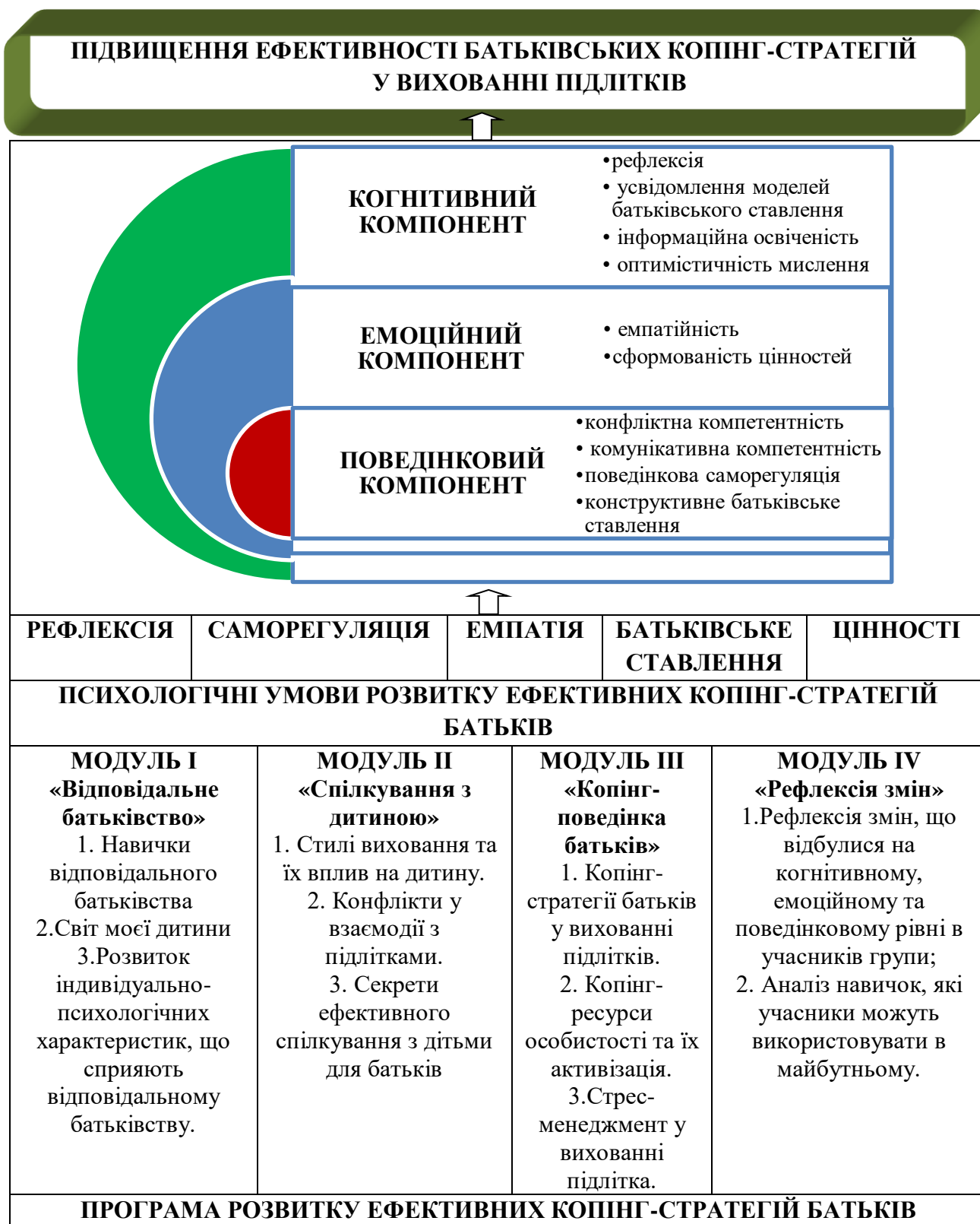
Рис. 1. Модель розвитку ефективних копінг-стратегій батьків у вихованні підлітків

Нами була розроблена модель розвитку ефективних копінг-стратегій батьків (рис.1).