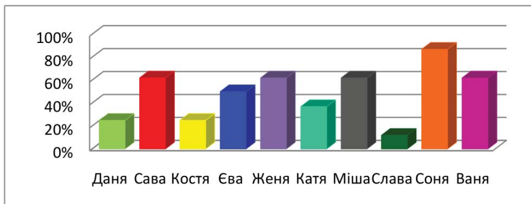
Рис. 2. Коефіцієнт довготривалої слухової пам'яті за методикою «Десять слів»

Також спостерігалися заміни у звучанні слів. Наприклад, діти називали слово «стіл» замість «стілець». Аналіз таких помилок може означати, що в більшості випадків діти допускають помилки, що призводять до малого обсягу запам'ятовування слів. Наслідком є невисока ефективність запам'ятовування слів. Результати досліджень особливості довготривалої слухової пам'яті, згідно з методикою «Десять слів» можна продемонструвати за допомогою рисунку 2.