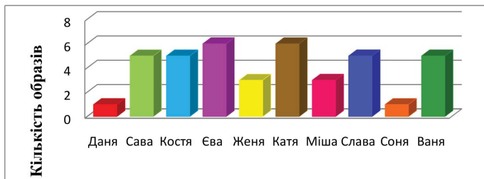
Рис. 3. Розвиток зорової пам'яті у дітей молодшого шкільного віку з розумовою відсталістю. Методика «Пам'ять на образи»

У підсумку зазначаємо, що двоє учнів назвали по 6 предметів. Це означає, що вони мають високий рівень розвитку зорової пам'яті.