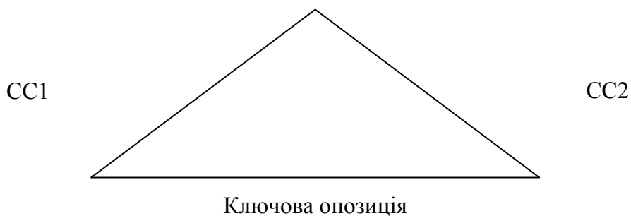
Рис. 1, де СС – синхронічний схемообраз

Розумінню тексту сприяє розуміння семантичної структури тексту та мінімальної семантичної структури тексту. С. В. Куліков виділяє мінімальну семантичну структуру, на основі того, що індивід сегментує дійсність синхронічно (виявлення ситуації на момент сприйняття) або діахронічно (фіксування динаміки розвитку ситуації в схемообразі) [4, с. 11]. Можна сказати, що мінімальною семантичною структурою тексту є смислова структура, що допомагає створити діахронічний схемообраз, відтворюючи синхронічні схемообрази, які є складовими частинами діахронічного схемообразу. Вирішальним в мінімальній семантичній структурі є ключова опозиція, яка логічно завершує ситуацію. Доведенням цієї теорії слугує ряд робіт та експериментів К. Левіна, І. М. Бернана, В. А. Адмоні, які показують, що в ході смислового сприйняття реципієнт переживає стан напруженості, який не знімається, якщо повідомлення не є закінченим. Це можна пояснити відсутністю ключової опозиції, яка увінчує діахронічний образ і є третьою стороною трикутника (мал. 1) [4, с. 15]