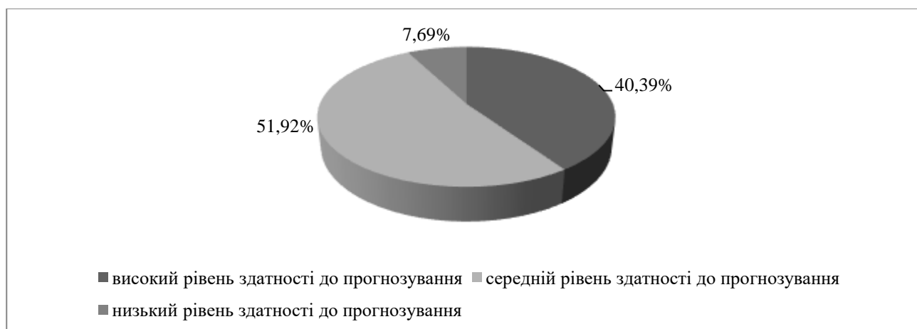
Рис. 2. Інтегральний показник рівня розвитку здатності дорослих до прогнозування

Згідно Л. Регуш, здатність до прогнозування – це здатність до складання життєвих проєктів і життєвої самореалізації (Регуш, 2003). У досліджуваній групі інтегральний показник здатності до прогнозування знаходиться на високому (40,39%) та середньому (51,92%) рівнях. Респондентів з низьким рівнем здатності до прогнозування в досліджуваній групі виявлено – 7,69%. Результати кількісного розподілу презентовані на діаграмі (див. Рис. 2).