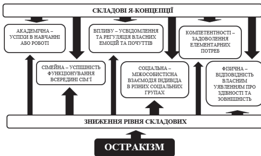
Рис. 3. Вплив остракізму на складові Я-концепції за А. Bracken

• Соціальна складова: здатність розуміти внутрішню організацію і структуру особистості оточення, правильно інтерпретувати їхні почуття та емоції, керувати проявами своїх емоцій, вибудовувати ефективні відносини з учасниками групових процесів (Mascllet, D., 2003).