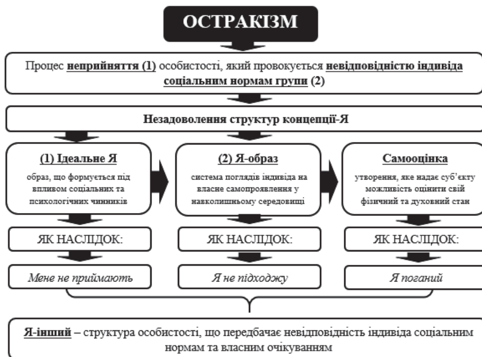
Рис. 1. Вплив остракізації на формування системи поглядів «Я – інший» за К. Роджерсом

З представленої схеми видно, що процес остракізму впливає на незадоволення структури «Ідеальне Я» через неприйняття особистості групою та Я-образу індивіда через невідповідність соціальним нормам, що може спричинити зниження самооцінки. Як наслідок формуються негативні патерни самосприйняття та структура «Я – інший».