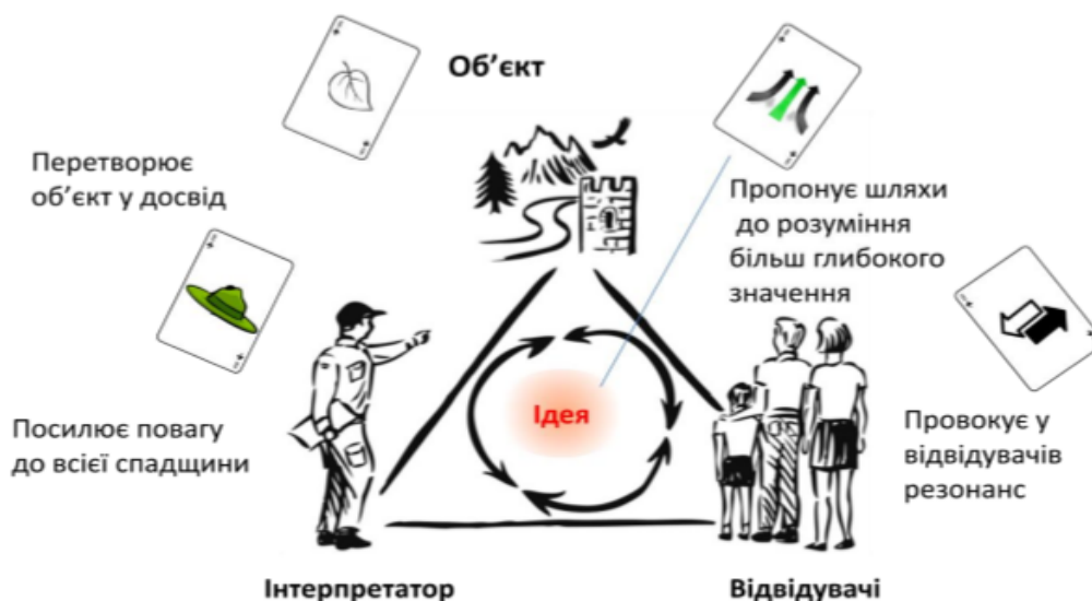
Рис. 2. Схема процесу інтерпретації

Також метод інтерпретації може використовуватися в поєднанні з іншими методами і методичними прийомами, що слугуватимуть елементами комунікації, зокрема: опис, спостереження,