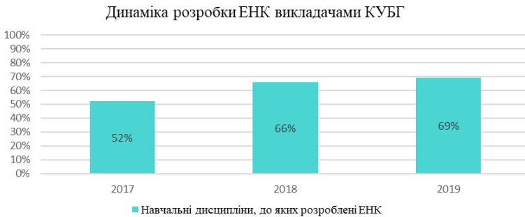
Рис. 3. Порівняльний графік показників розробки ЕНК викладачами КУБГ за 2017–2019 рр.

Ще одним важливим показником ефективності реалізації Нової освітньої стратегії та інноваційного підходу до освітнього процесу Київського університету імені Бориса Грінченка є реалізація системи дистанційного навчання. Зокрема, розробка електронних навчальних курсів. Спостерігається постійна позитивна динаміка в розробці ЕНК протягом 2017–2019 рр. [7].