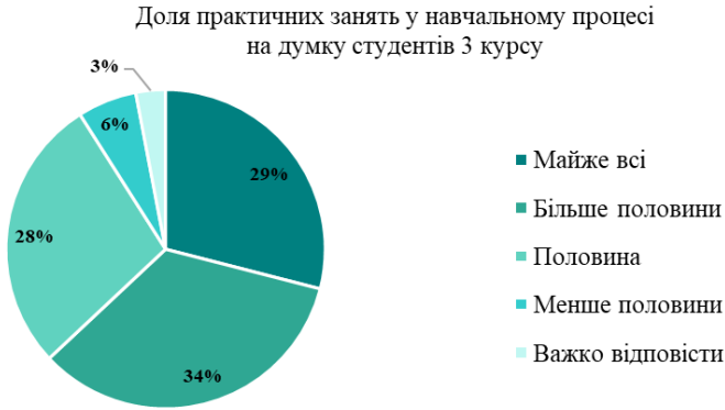
Рис. 2. Результати опитування студентів щодо практичної спрямованості навчання (2019 р.)

Також у грудні 2019 року адміністрацією університету було проведено опитування студентів-третьоккурсників, які три роки навчаються за Новою освітньою стратегією Університету. У опитування взяли участь 74% студентів від загальної кількості третьоккурсників. Результати опитування підтверджують, що студенти відчують практичну орієнтованість занять [7].