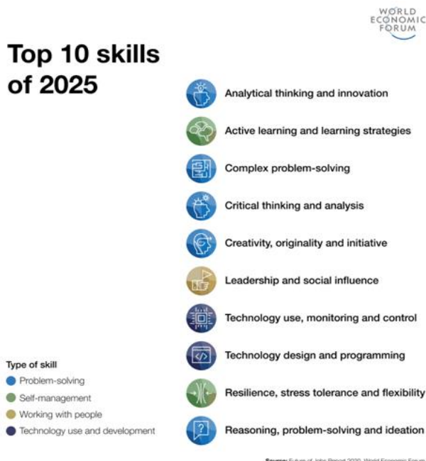
Рис. 1. Основні десять навичок 2025 року [1]

У жовтні 2020 року Всесвітній економічний форум (World Economic Forum) опублікував свій черговий звіт "Майбутнє робочих місць 2020" (The Future of Jobs Report 2020) [1], у якому була представлена докладна інформація за 15 галузями промисловості і 26 розвиненими країнами, а також країнами, що розвиваються. До основних навичок і груп навичок, необхідність у яких, на думку роботодавців, до 2025 року буде зростати, належать такі, як критичне мислення й аналіз, вирішення проблем, а також навички самоврядування, такі як активне навчання, стійкість, стресостійкість та гнучкість [1]. Зауважимо, що перше місце в топ-десятиці навичок 2025 року посідають аналітичне мислення та інноваційність.