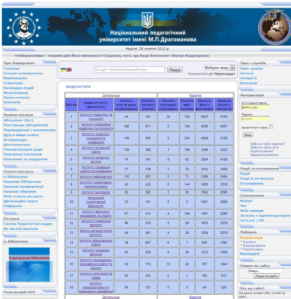
Рис. 2. Демонстрація на порталі www.npu.edu.ua рейтингу основних компонентів роботи модераторів сайтів інститутів

Необхідно також відмітити, що доступ до результатів рейтингу викликає підвищений інтерес у керівництва підрозділів до роботи їхніх модераторів сайтів. Безумовно, для наступних етапів функціонування portalу, коли значно зростає кількість постійних користувачів, до критеріїв оцінювання роботи модераторів сайту можна додати, наприклад, показники технічної естетики portalу.