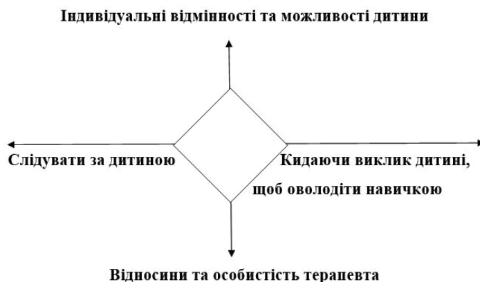
Рис. 2. Взаємодія терапевта та дитини

Ключовим моментом Floortime є наслідування дитини та приєднання до дитини в її інтересах (тобто емоційно значущих видах діяльності чи темах). За словами Цакіріса (Tsakiris), під час Floortime дорослий використовує підказку для дитини, щоб визначити, які дії/відповіді вона буде робити/давати, одночасно фіксуючи емоційний тонус дитини та підтримуючи почуття зв'язку, навіть якщо це несе суперечливий характер. Таким чином, взаємодія є спонтанною за своєю суттю, експериментальною і заснованою на моменті «тут», отже, в кінцевому рахунку вона має значення для самої дитини. Нами на рис. 2 представлено взаємодію дитини та дорослого у процесі терапії.