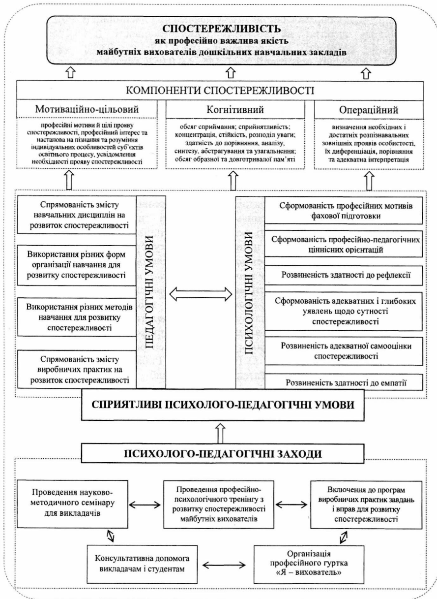
Рис. Модель розвитку спостережливості майбутніх вихователів дошкільних навчальних закладів у процесі професійної підготовки