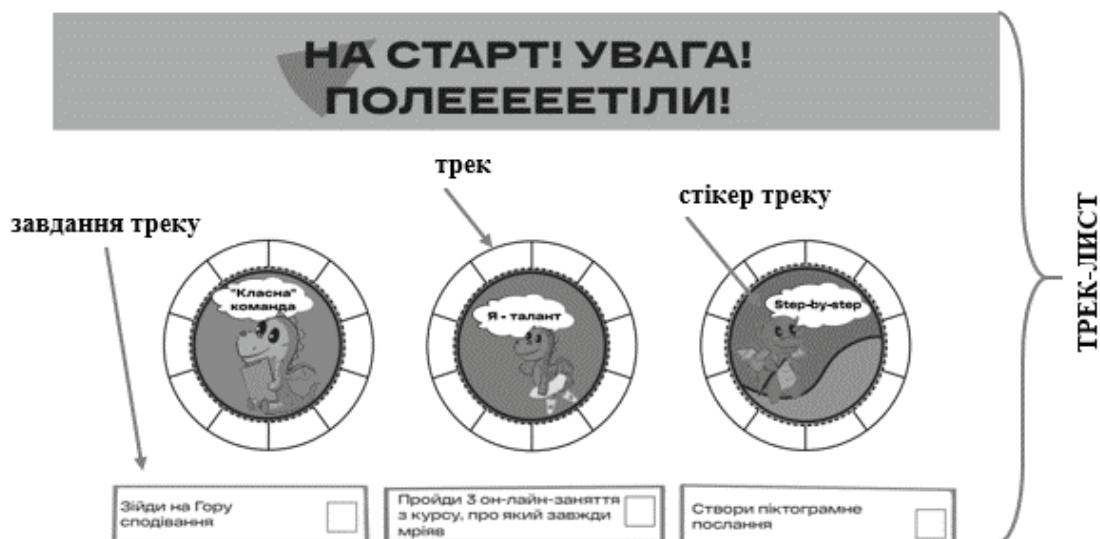
Рис. 2. Сторінка з трекінгом інваріантних треків смарт-альбому особистісного зростання