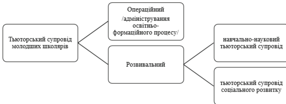
Рис. 1. Компоненти тьюторського супроводу молодших школярів у приватній школі

Аналіз досвіду науково-практичної діяльності щодо впровадження авторської технології тьюторського супроводу молодших школярів на базі 25 класів початкових шкіл мережі приватних закладів освіти «КМДШ» (Київ і Львів) дає можливість зважено узагальнити, що тьюторський супровід молодших школярів за своїм функціональним змістом є синтезом операційної та розвивальної тьюторської діяльності, який передбачає низку конкретизованих задач (рис. 1).