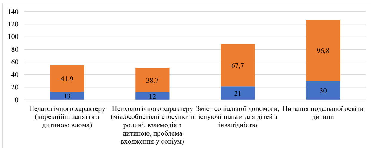
Рис. 2. Відповіді респондентів на запитання “Якої саме інформації Вам не вистачає і хотіли б отримати?”

У контексті отримання освітніх послуг, а саме щодо закладу освіти “Центр розвитку дитини “Я+сім’я”, більшість батьків (27 осіб; 87,1 %) оцінили як “задовільно” та одна особа (3,2 %) – “чудово”. Варто зазначити, що батьки потребують додаткової інформації з питань виховання, навчання дитини, догляду (21 осіб; 67,7 %). На рис. 2 презентовано відповіді щодо видів цієї інформації.