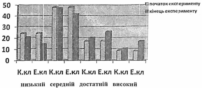
Рис.1. Динаміка інтелектуального розвитку учнів контрольних та експериментальних 5-9 класів на уроках трудового навчання

тобто між розробленими нами методичними умовами та інтелектуальним розвитком існує зв'язок.