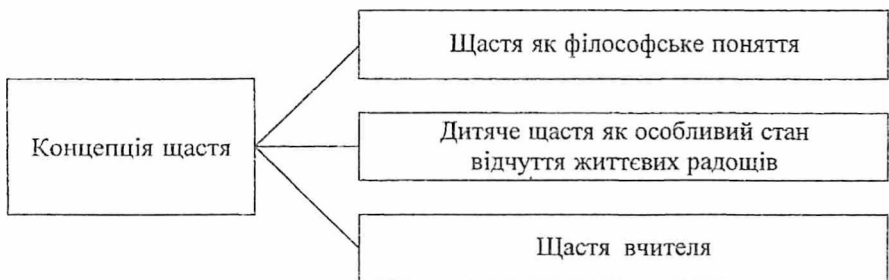
Рис. 2. Концепція щастя у педагогіці В. Сухомлинського

Він розробив власну концепцію щастя (рис. 2), яка розглядається в трьох аспектах: щастя як філософське поняття, дитяче щастя як особливий стан відчуття життєвих радощів, щастя вчителя. В. Сухомлинський обґрунтував теорію педагогічного щастя, яке трактував як найтіснішу єдність дитячого щастя і щастя вчителя. У філософії дитячого щастя В. Сухомлинського провідною є ідея, що кожна дитина має свою вершину, а мета педагогічних зусиль учителя і батьків – допомогти досягти її, виховати дитину щасливою.