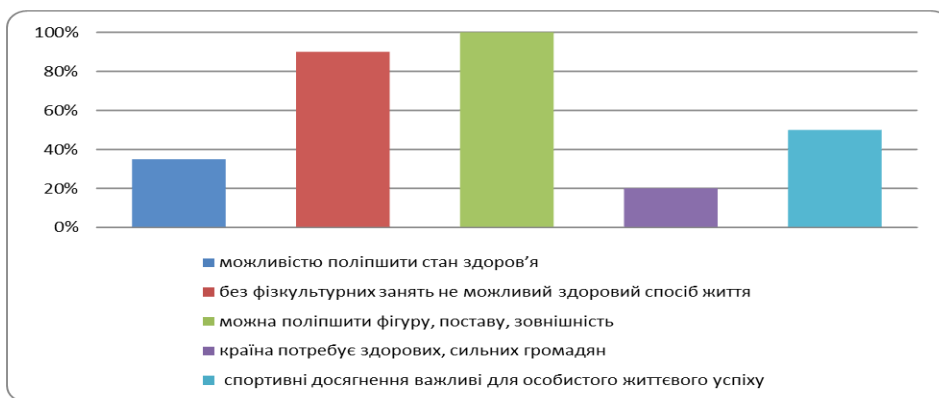
Рис.3.1. Мотиви нових клієнтів до занять фітнесом

Необхідність продовження підтримки та мотивації зі сторони тренера учасників занять до їх систематичного відвідування фітнес-тренери ставляться (рис.3.2): підтримую необхідність такої діяльності – 60%; мотивація скоріше потрібна, чим ні – 20%; мотивацію формувати не потрібно – 10%; важко відповісти – 10%.