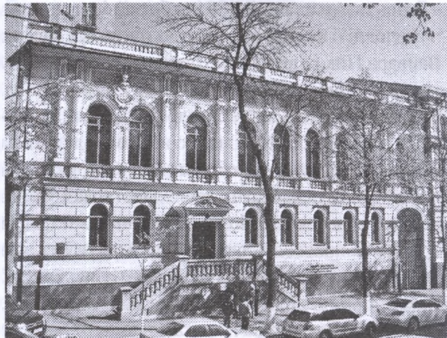
Особняк і музей Ханенків