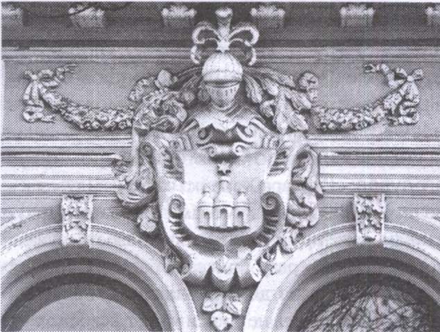
Фамільний герб Ханенків на фасаді будівлі музею