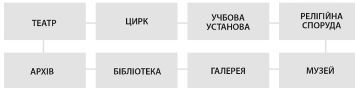
Схема 1. Образна модель устрою блоків пам’яті людини за Г. Поповим як результат застосування зовнішнього методу вивчення пам’яті.

На даному етапі повертаємося до слів академіка Г. Попова: “Все, що існує в пам’яті самої людини, то існує і зовні” [14, с. 46]. Якими були його розмірковування? “Отже, розглянемо, а що у нас є зовні. Які б установи, об’єкти ми могли би віднести до пам’яті?” [14]. За суттю, Г. Попов першим запропонував розглядати існуючі інститути пам’яті як об’єктивовані результати успішної діяльності в суспільстві, як закріплені соціальні відносини пам’яті.