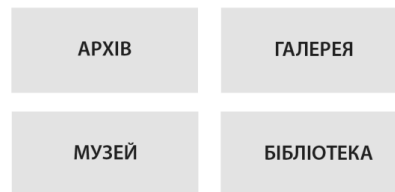
Схема 3. Статичні блоки пам'яті

Також в теоретичній моделі пам'яті Г. Поповим було виділено і проаналізовано 4 статичних блоків пам'яті , в яких згідно з різними принципами відбувається фіксація і подальше зберігання даних. Ці блоки в образній моделі Г. Попова іменуються: “архів”, “бібліотека”, “музей” і “галерея” (дані назви в образній моделі дозволяють виділити атрибутивну складову функціоналу блоку пам'яті і його логіку) [14, с. 46].