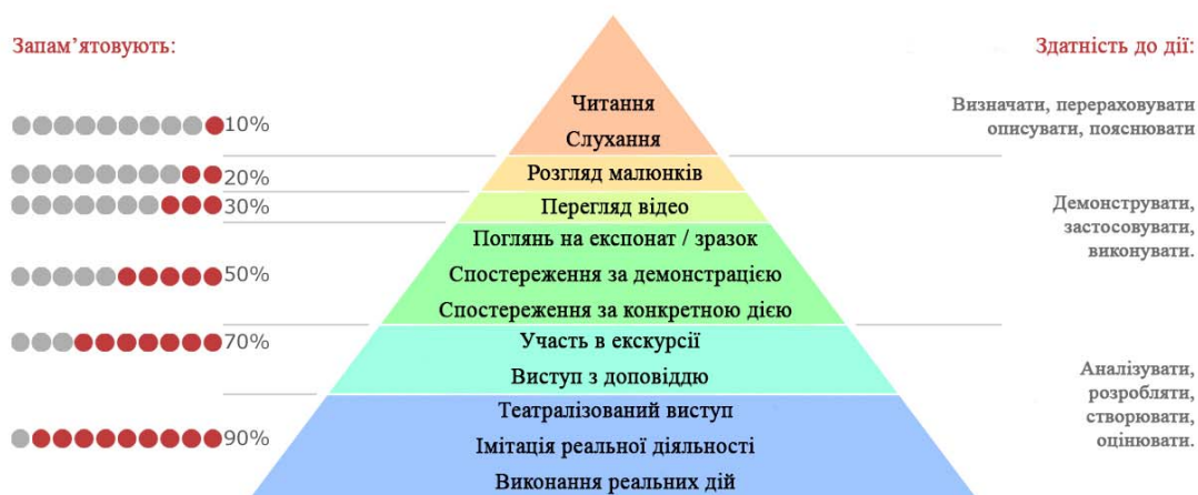
Рис. 1. Конус навчання Едгарда Дейла