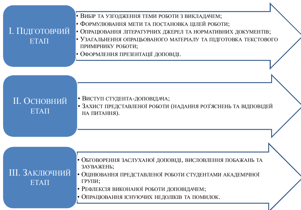
Рис. 4. Алгоритм виконання індивідуальних завдань студентами-провізорами