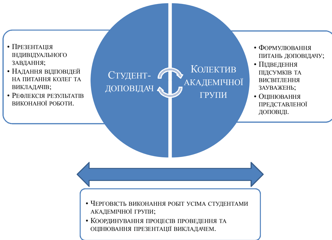
Рис. 1. Механізм саморегуляції процесу оцінювання студентами-провізорами виконуваних індивідуальних завдань