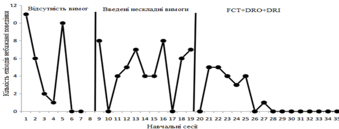
Малюнок 2. Кількість епізодів цільової поведінки у вигляді дряпання, ударів кулаками та кидання предметів.

На малюнку 2 представлені результати зміни кількості епізодів цільової поведінки на заняттях. На перших заняттях функцією негативної поведінки було привернення уваги. В результаті застосування «Тренінгу функціональної комунікації», що проводився в рамках корекції поведінки з функцією залучення уваги, поведінка стабільно знижувалася до її припинення на останніх двох заняттях.