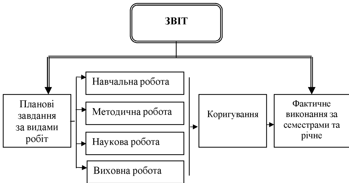
Рис. 2. Алгоритм річного звіту кафедри за виконання навчальної, наукової, виховної, методичної та організаційної роботи

Науково-педагогічний працівник під час написання звіту користується нормативами для планування та обліку методичної, наукової, організаційної та виховної роботи науково-педагогічних працівників. Нормативами вказуються види роботи, нормативи часу, години. За звітами науково-педагогічних працівників складають зведений звіт кафедри [12].