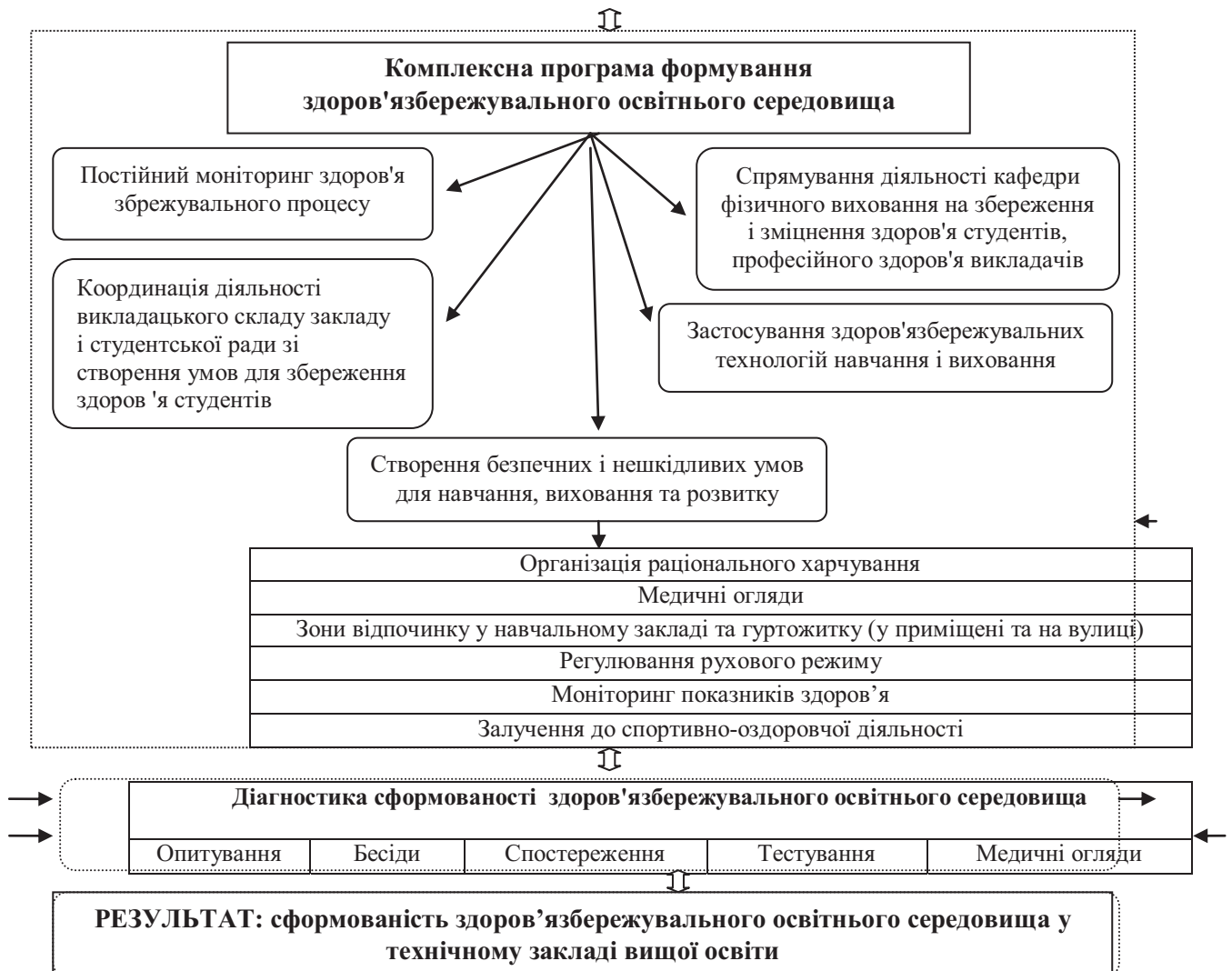
Рис. 1. Модель формування здоров'язбережувального освітнього середовища в технічному закладі вищої освіти

5. Комунікативний компонент - компетентність у спілкуванні з викладачем та адміністрацією, сформованість у студентів умінь доступно і логічно передавати інформацію іншим студентам, здатність всебічно й об'єктивно сприймати людину-партнера за спілкуванням не порушуючи власну захищеність, безпеку та емоційний комфорт.