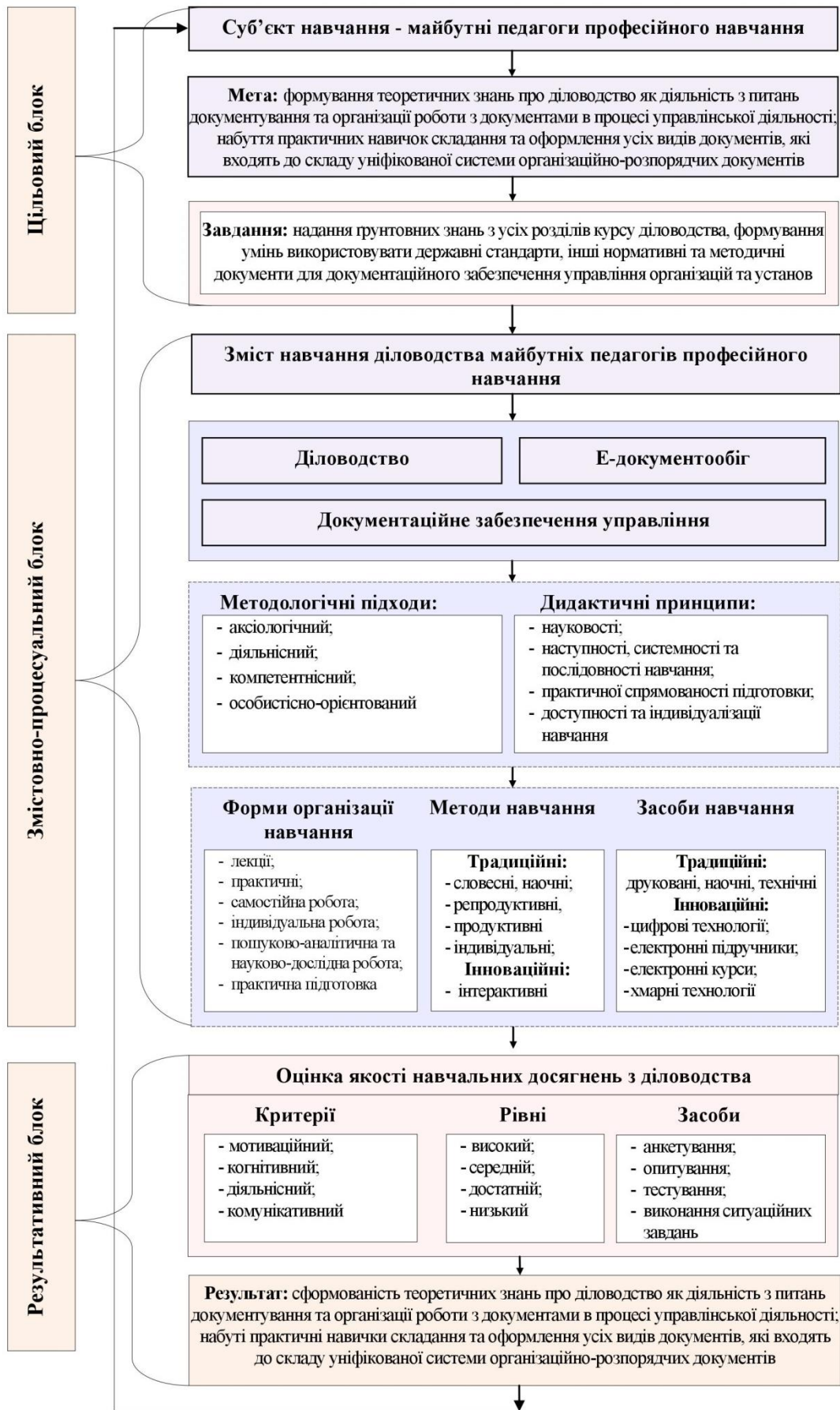
Рис. 1. Модель методики навчання діловодства майбутніх педагогів професійного навчання із застосуванням цифрових технологій