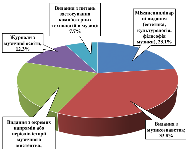
Рис. 1. Тематика журналів з музичного мистецтва та освіти в наукометричній базі Scopus