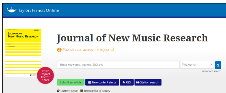
Рис. 3. Головна сторінка журналу Journal of New Music Research ( https://www.tandfonline.com/toc/nnmr20/current )

Ціла низка журналів з музичного мистецтва наукометричної бази Scopus висвітлюють музично-історичні дослідження окремих музичних напрямів, періодів історії музики та музичної творчості окремих країн світу. Серед них: American Music ( https://www.press.uillinois.edu/journals/am ).