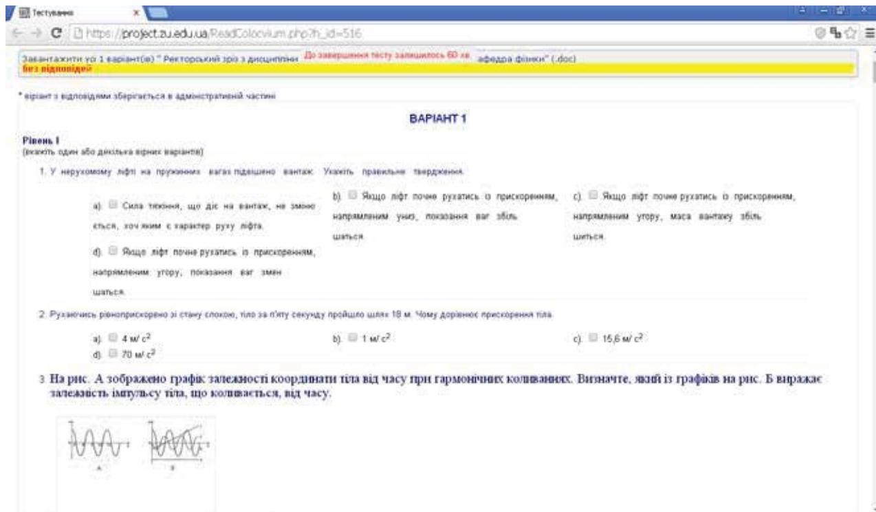
Рис. 3. Згенерований варіант тесту

Оскільки тестова база містить якісні, розрахункові, графічні, експериментальні, комбіновані завдання різних рівнів складності та різних форм, то можна стверджувати, що вона є достатньо ефективною в побудові рейтингової системи оцінювання навчальних досягнень майбутніх учителів фізико-математичного профілю з погляду об'єктивності, справедливості і забезпечення рівного доступу всіх, хто бажає здобути вищу освіту.