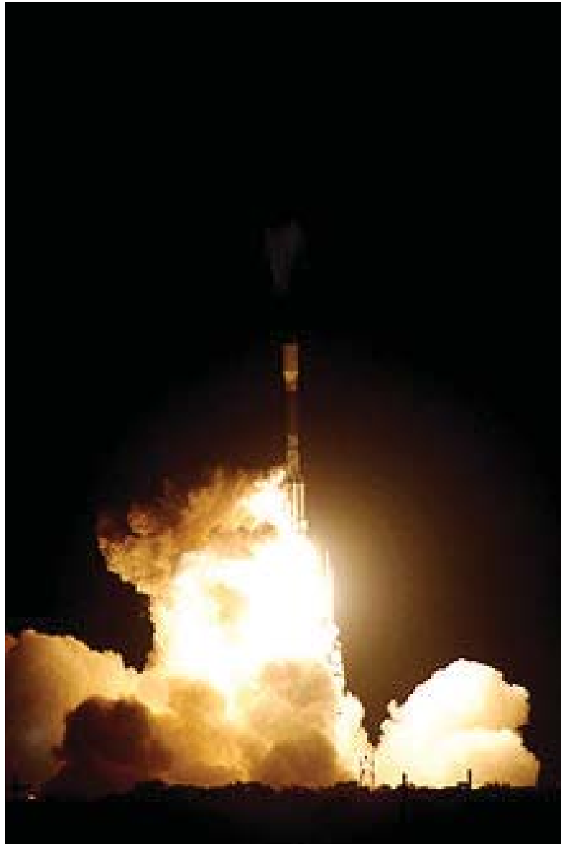
Старт ракети "Дельта ІІ" з "Кеплером"

Спочатку було заплановано, що місія "Кеплер" продовжиться три з половиною роки. Весь цей час він проводив спостереження за близько 100 тисяч схожих на Сонце зірок, навколо яких можуть обертатися екзопланети. Апарат здійснював пошук планети, що розташовані поза Сонячною системою, за допомогою транзитного методу. Коли планета проходить диском своєї зірки, вона закриває від спостерігача частину її випромінювання. Аналізуючи коливання яскравості світил, астрономи можуть не тільки знаходити планети, але також приблизно оцінювати їхній розмір.