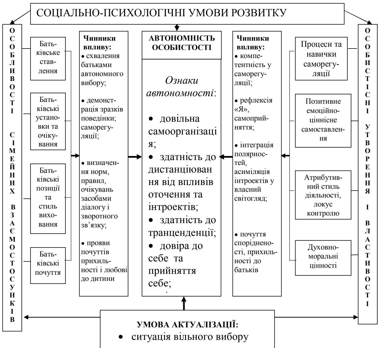
Рис. 1. Модель розвитку автономності особистості юнацького віку

Аналіз науково-методичної літератури з проблеми соціально-психологічних умов розвитку автономності особистості в юнацькому віці дозволив нам розробити наступну модель (рис. 1).