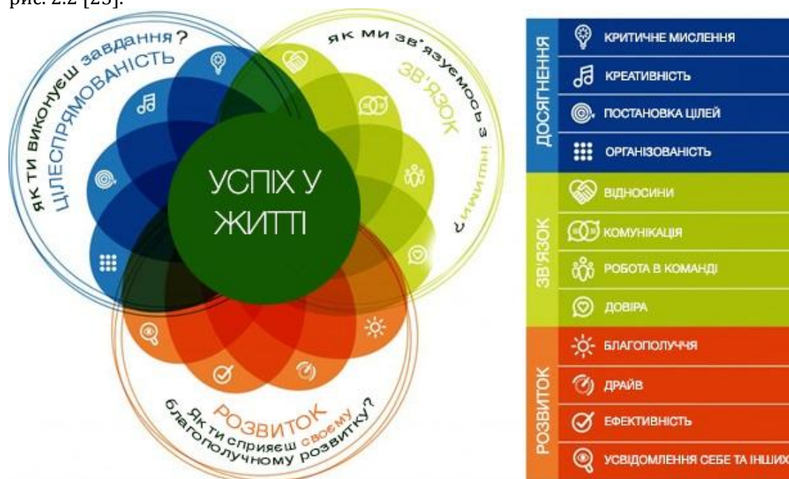
Рис. 2.2. Модель рамкових навичок «Досягни-Поєднай-Процвітай» («Achieve-Connect-Thrive» (ACT) Skills Framework)

Особливу увагу приділяє цифровим позначкам (digital badges) і моделі рамкових навичок «Досягни-Поєднай-Процвітай» («Achieve-Connect-Thrive» (ACT) Skills Framework). Це дозволяє поєднати позашкілья, навчання у школі і літні програми для учнів. Дана модель представлена на рис. 2.2 [25].