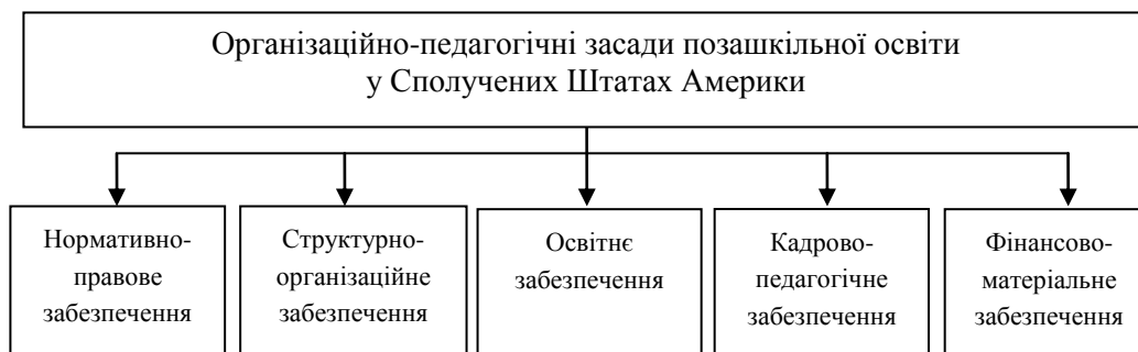
Рис. 2.1. Структура організаційно-педагогічних засад позашкільної освіти у Сполучених Штатах Америки

Розвиток позашкільної освіти у Сполучених Штатах Америки свідчить, що її успішне функціонування і процвітання забезпечується наявністю організаційно-педагогічних засад. З'ясовано, що до сучасних організаційно-педагогічних засад позашкільної освіти у США належить такі складові, як: нормативно-правове, структурно-організаційне, освітнє, кадрово-педагогічне, фінансово-матеріальне забезпечення (рис. 2.1).