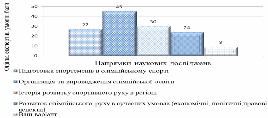
Рис. 2. Значимість напрямків наукових досліджень для розвитку системи олімпійської освіти України (результати експертизи)

В результаті проведених досліджень, встановлено, що кожен напрям наукових досліджень що здійснюється на базі регіональних центрів олімпійських досліджень та освіти має важливе значення в функціонуванні цих установ. Актуальними напрямками наукових досліджень в діяльності центрів олімпійських досліджень та освіти виступають: історія розвитку спортивного руху в регіоні та підготовка спортсменів в олімпійському спорті, що обумовлює фундаментальний підхід співробітників Центрів до наукових досліджень та вимагає чіткої системи організації науково-дослідного процесу, підбору ефективних форм і методів роботи, використання інноваційних технологій. Наступним кроком дослідження, було виявлення ефективних форм впровадження олімпійської освіти, що мають місце в діяльності регіональних центрів олімпійських досліджень та освіти в Україні. За результатами експертного опитування ( W \geq 0,7 ), найбільш ефективною формою впровадження олімпійської освіти, на думку експертів є – інтеграція олімпійської освіти у навчальні дисципліни (56 умовних балів), на другому місці (49 умовних балів) – проведення науково-дослідної роботи з олімпійської тематики, а на третьому (45 умовних балів) – організація роботи олімпійських музеїв, олімпійських галерей, кабінетів олімпійської освіти, на четвертому (36 балів) – організація спортивно-масової роботи з олімпійської тематики (рис. 3).