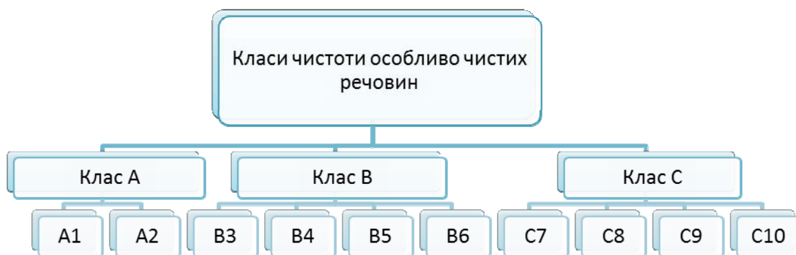
Рис. 3. Розподіл особливо чистих речовин на класи

Для більш детального оволодіння цими поняттями можна запропонувати розподіл особливо чистих речовин (рис. 3).