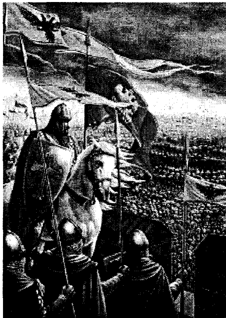
Константин Палеолог перед останнім боєм з османами