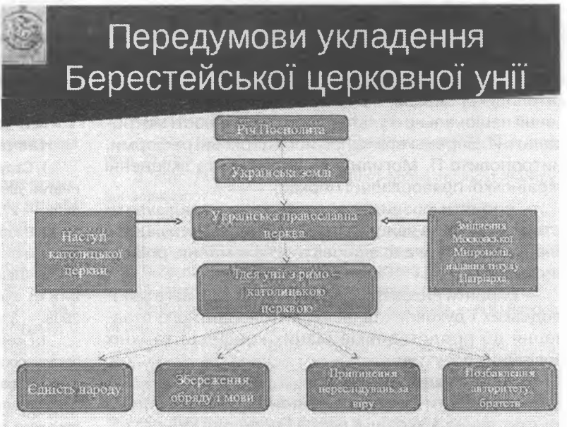
Передумови укладення Берестейської церковної унії