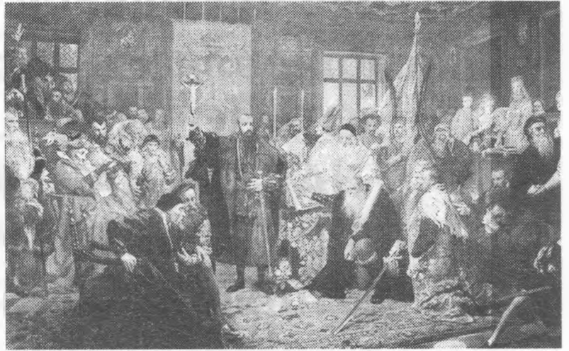
Берестейська унія (Картина Яна Матейка)