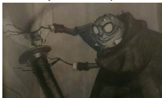
Рис. 8 Обійми Павука