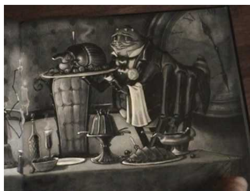
Рис. 6. Пригошення Павука