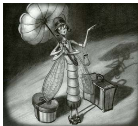
Рис. 2. Образ Мухи.