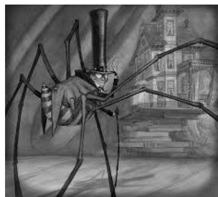
Рис. 4. Павук і його будинок.