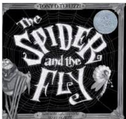
Рис. 1. Обкладинка книги «The Spider and the Fly».