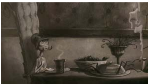
Рис. 7. Муха в гостях у Павука