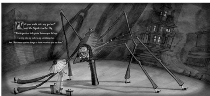
Рис. 3. Перша сторінка книги.