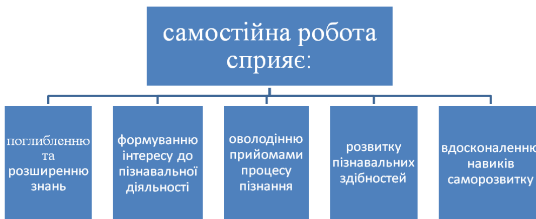
Рис. 1. Педагогічні можливості самостійної роботи

Тому вона стає головним резервом підвищення ефективності підготовки спеціалістів, оскільки ґрунтується переважно на процесах саморозвитку (рис. 1).