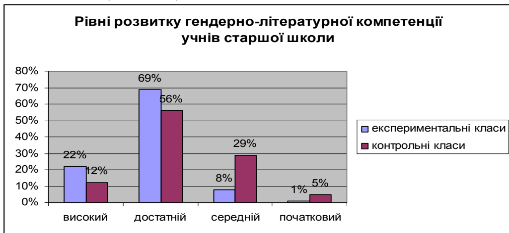
Рис. 3.1. Рівні розвитку гендерно-літературної компетенції учнів старшої школи

Результати тестового зрізу підтвердили позитивні зрушення у формуванні гендерно-літературної компетенції старшокласників, які навчалися в експериментальних класах, порівняно з тими, хто здобував літературну освіту за традиційною методикою (Рис. 3.1.).