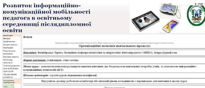
Рис.1. Головна сторінка навчального курсу

Після ознайомлення з матеріалами теоретичного характеру педагоги апробують і відпрацьовують практичні методи і прийоми створення освітнього контенту в тренінговому режимі. В процесі спільної роботи вони навчаються розробляти різного типу та призначення документи, організовувати взаємодії з колегами, учнями, плануванню індивідуальної, групової та колективної роботи учнів тощо.