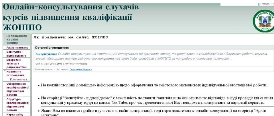
Рис.3. Головна сторінка сайту консультування онлайн

Таким чином, в результаті використання онлайн-сервісів Google в освітньому процесі нам вдалось вирішити ряд завдань, а саме: