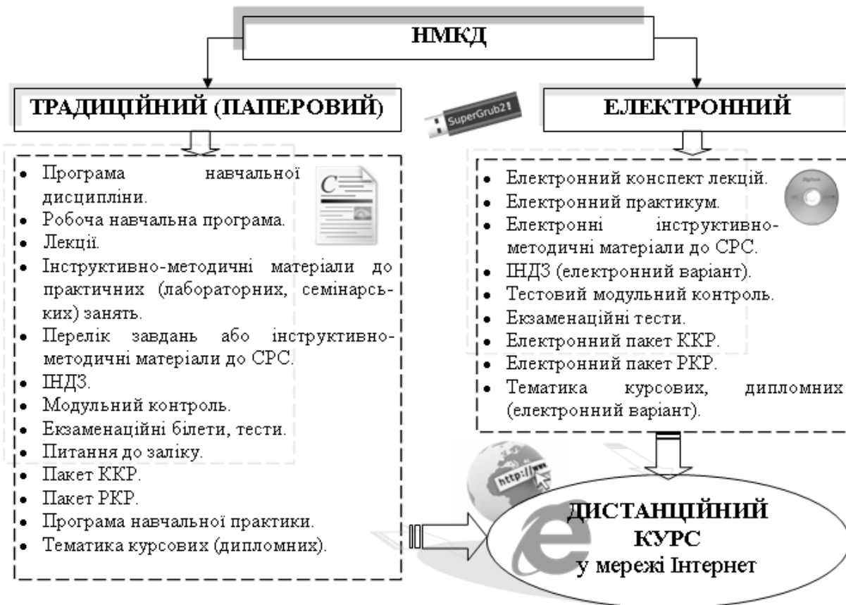
Рис. 2. Структура НМКД для підготовки МУОЗ

Українські дослідники Н. Кононець, В. Кухаренко, О. В. Рибалко, Н. Г. Сиротенко визначають дистанційний курс як інформаційний продукт, який містить навчально-методичні матеріали до занять та забезпечує цілісний процес, що включає пошук відповідної інформації в мережах, обмін електронними листами як з куратором курсу, так і з іншими слухачами, звертання до баз даних, періодичним інформаційним виданням, розповсюджуваних за допомогою Інтернет [8; 9]. Як правило, дистанційні курси є упорядкованим зібранням НМЗ і організуються у мережі Інтернет за допомогою спеціальних платформ та програм. Вони надають можливість реєстрації для доступу до НМЗ окремої дисципліни, вивчення матеріалів на відстані, консультацій з викладачем, контроль знань через мережу Інтернет. Структуру НМКД для підготовки МУОЗ у педагогічному ВНЗ подано на рис. 2.