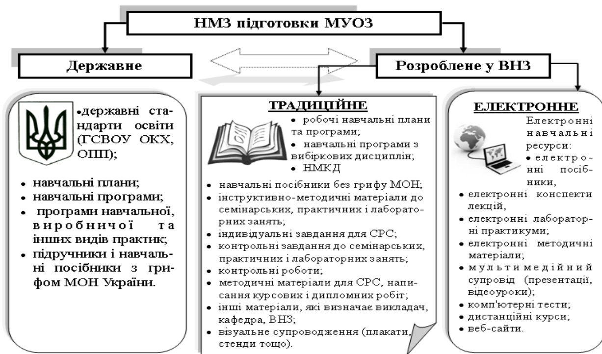
Рис. 1. НМКД підготовки МУОЗ у педагогічному ВНЗ

– матеріали для контролю навчальних досягнень студентів: контрольні питання, контрольні завдання, тести для проведення поточного та підсумкового контролю тощо [3].