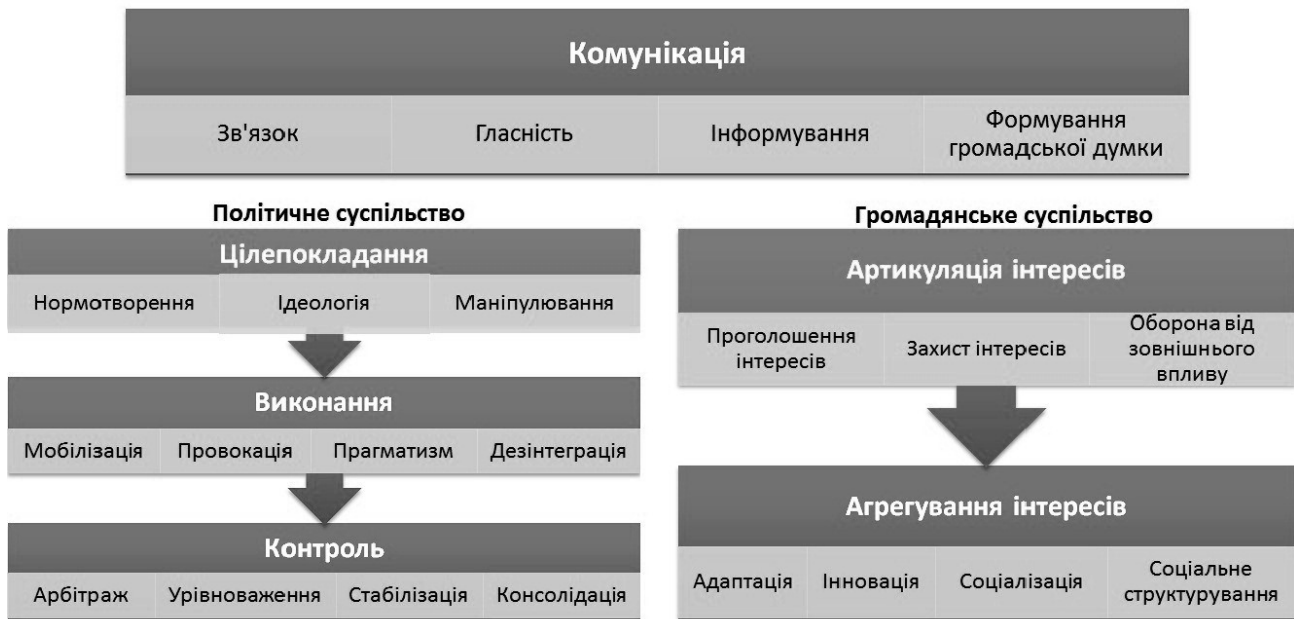
Рисунок 1 – Схема функцій політичного впливу

Комунікативні функції формують системні відношення на всіх рівнях. Ця група включає функції встановлення зв'язків між учасниками взаємодії, поширення й обмін інформацією, забезпечення гласності, відкритості рішень та дій. Зрозумілим наслідком цих процесів стає функція формування громадської думки – закріплення спільних поглядів, оцінок, суджень суспільства щодо актуальних подій і процесів. При чому, комунікативні процеси можуть відбуватися як спонтанно так і цілеспрямовано програмуватися зацікавленими інститутами.