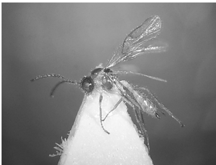
Рис. 1. Загальний вигляд Lysiphlebus hirticornis Mackauer, 1960, ♀

Самка (рис. 1). Голова поперечна (ширина голови в 1,7-1,8 раз більша за її довжину дорсально), ширша грудей на рівні текул (1:0,8), в довгих негустих волосках, що стирчать перпендикулярно до її поверхні. Голова зверху і збоку темно-коричнева, спереду (лоб, лице, кліпеус, ротові органи і, частково, щоки) – світліша: жовта або рудувата. Очі невеликі, округлі, голі, коричневі. Скроні більш або менш округлі, їх дорсальна довжина майже дорівнює поперечному діаметру ока. Очка в прямокутному або тупокутному трикутнику. Лице широке, його ширина більша за висоту в 1,5-1,8 разу. Тенторіальні ямки глибокі, добре помітні. Тенторіальний індекс – 0,5-0,6.