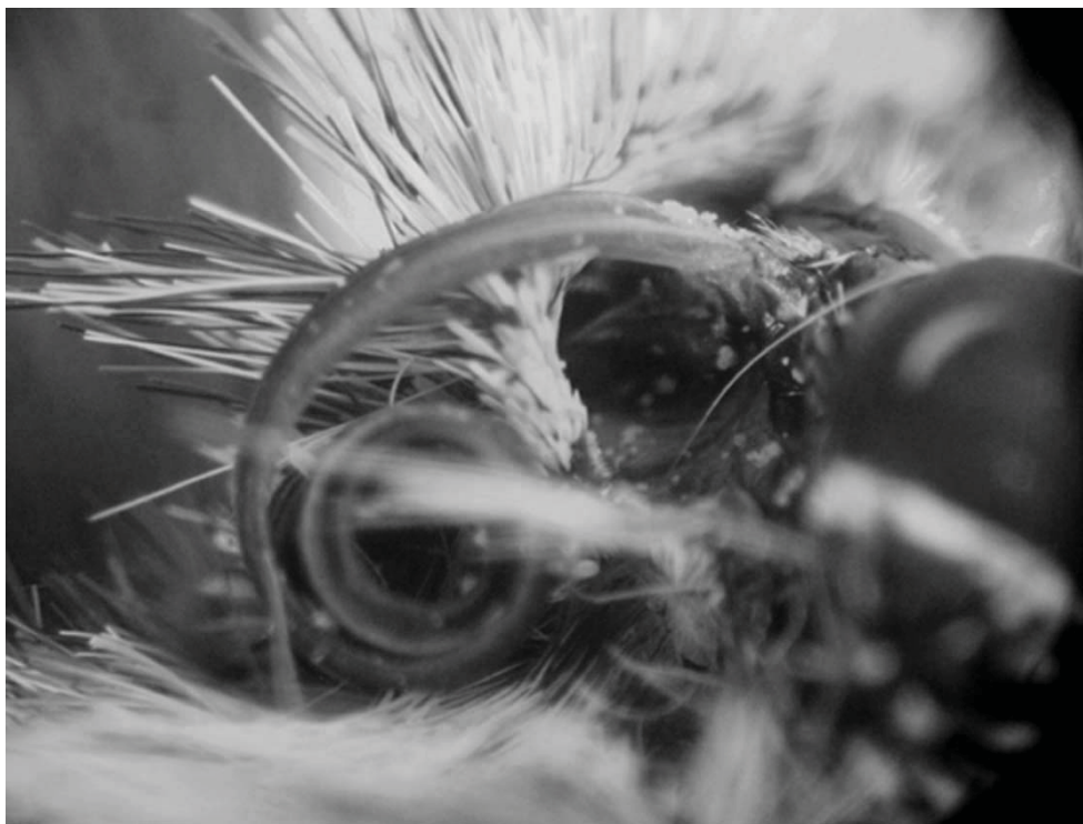
Фото 1. Голова і хоботок метелика Thymelicus silvestris L.

Зазвичай лускокрилі не дуже добре адаптовані до перенесення пилку. Пилкок найчастіше осідає на хоботку, поверхні голови, на грудях, на нижньому боці черевця, на ногах і вусиках ( фото 1, 2).